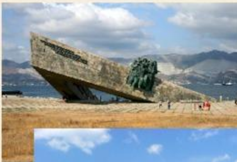
Мемориал «Малая земля»