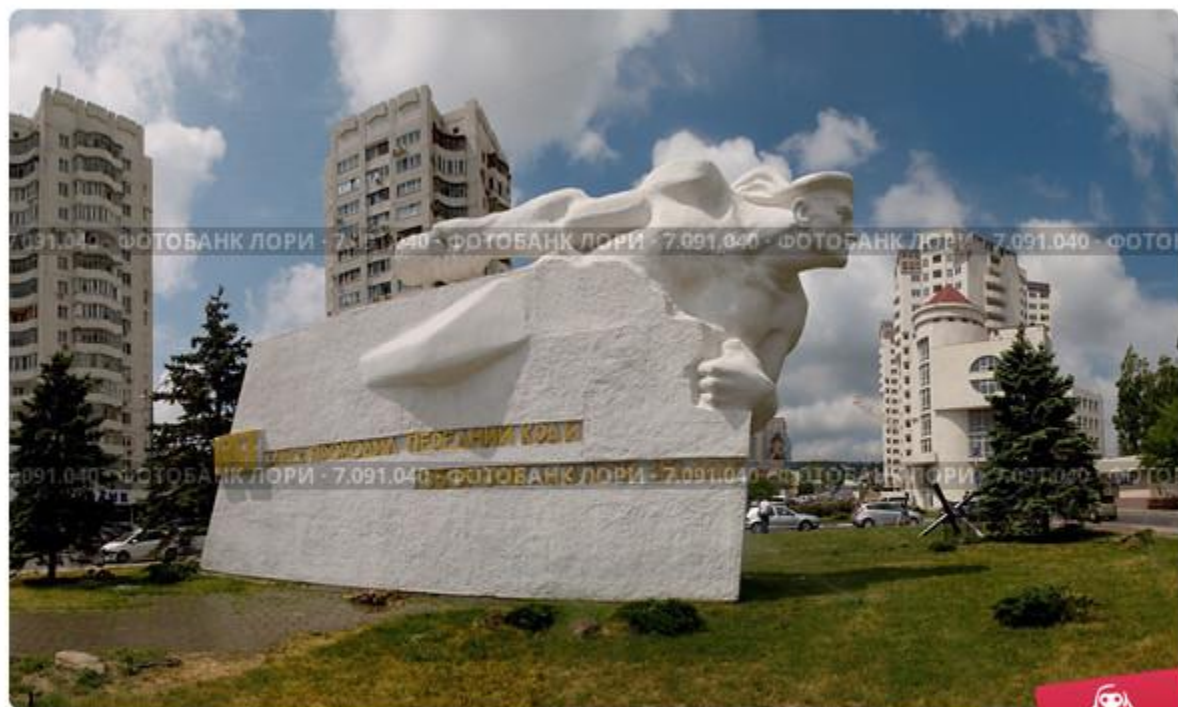
Памятник "Матрос с гранатой", город-герой Новороссийск