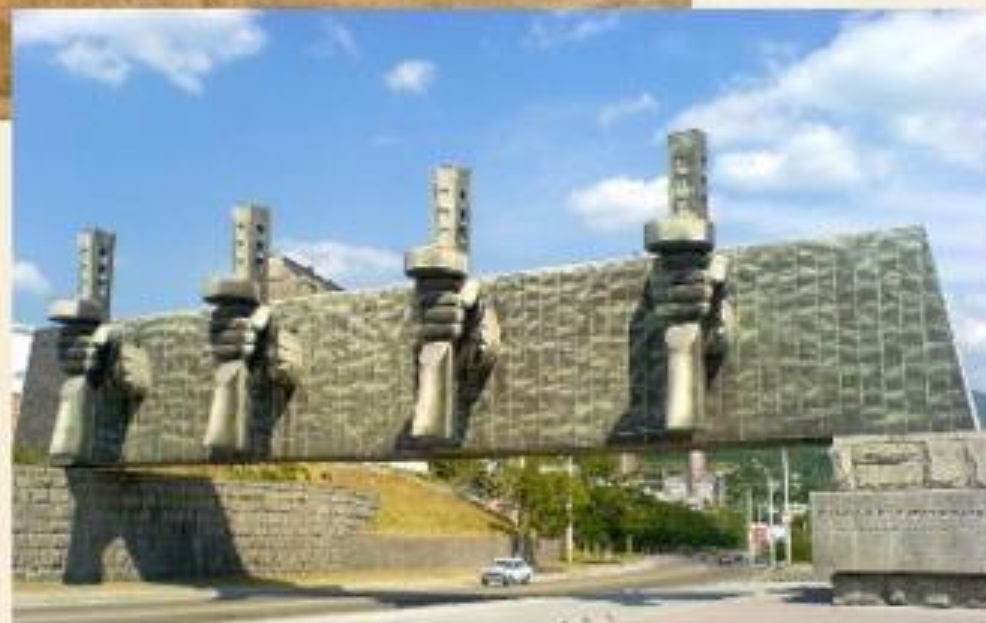
Мемориальный комплекс «Рубеж обороны»