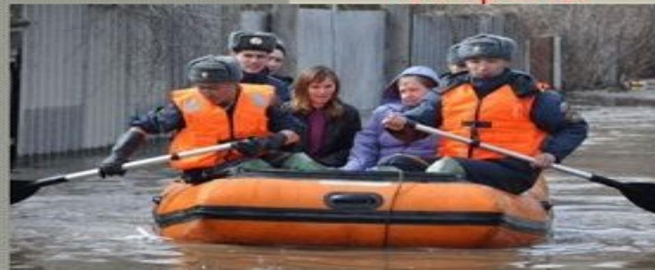
Войска Гражданской обороны