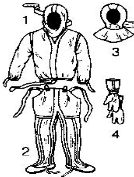
Рис. 36. Легкий защитный костюм Л-1: 1 — рубаша с капюшоном; 2 — брюки с защит- ными чулками; 3 — подшлемник; 4 — перчатки