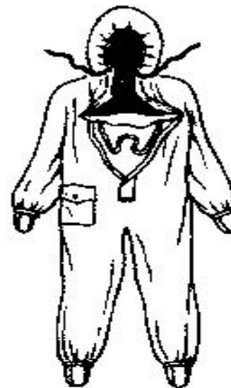
Рис. 37. Комплект защитной фильтрующей одежды