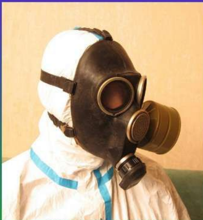
ГРАЖДАНСКИЙ ПРОТИВОГАЗ ГП-7