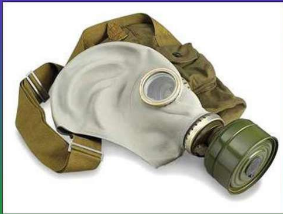
ГРАЖДАНСКИЙ ПРОТИВОГАЗ ГП-5