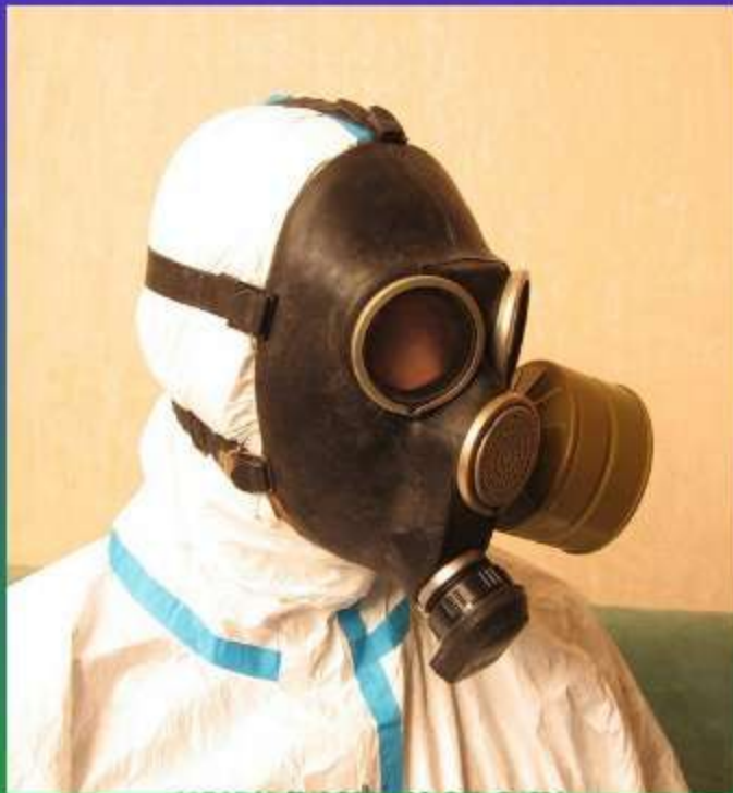
ГРАЖДАНСКИЙ ПРОТИВОГАЗ ГП-7