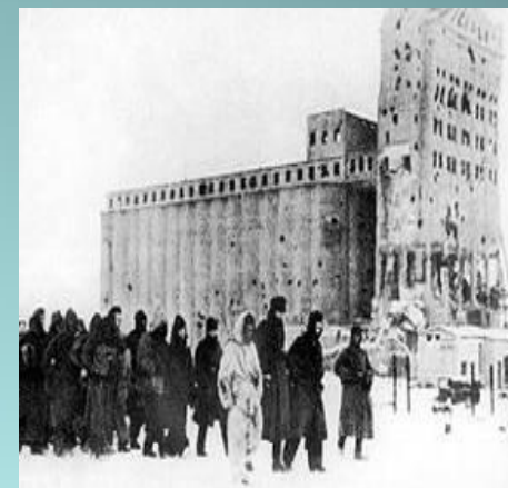
Пленённые под Сталинградом немецкие солдаты. Февраль 1943 года.