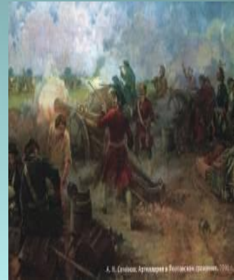
А. Н. Савилов. Артиллерия в Полтавском сражении, 1916 г.