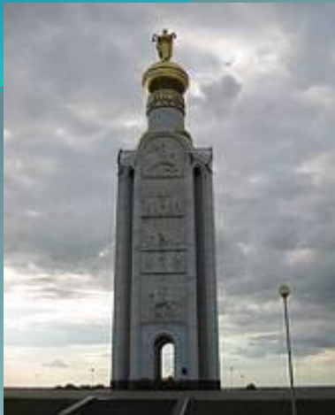
Звонница в память о погибших на Прохоровском поле