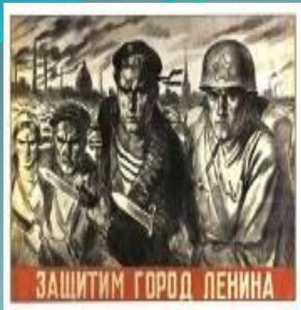
Советский плакат 1941—1943 гг.