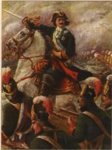
Пётр I во время Полтавской битвы.