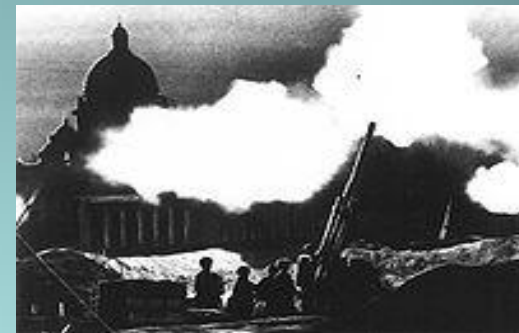
Отражение авианалёта на Ленинград