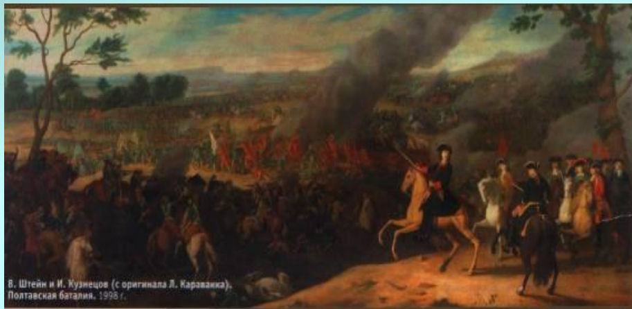
В. Штейн и И. Кузнецов (с оригинала Л. Каравакки). Полтавская баталия, 1993 г.

Полтавское сражение предопределило победоносный для России исход длительной Северной войны и подняло международный авторитет России. Военное могущество шведов было подорвано, слава о непобедимости Карла XII развеяна.