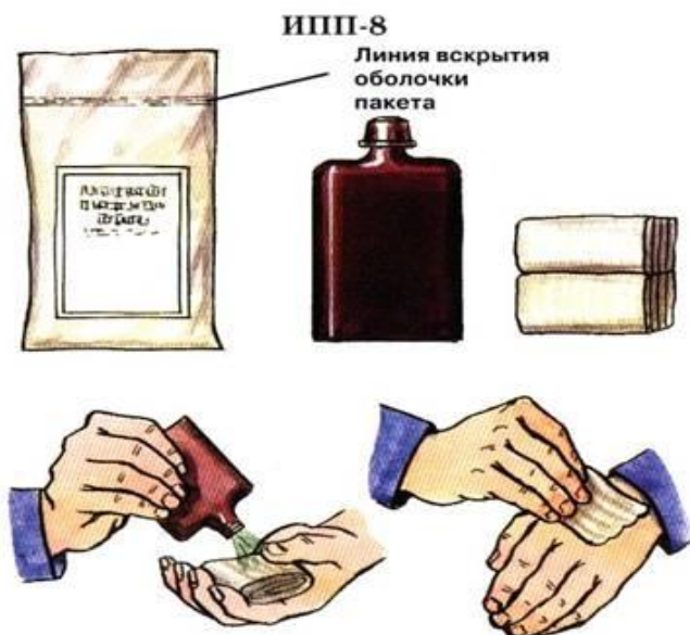
ИПП-8 Линия вскрытия оболочки пакета

Индивидуальные противохимические пакеты и перевозочные пакеты. (ИПП-8,ИПП,ИПП-10)