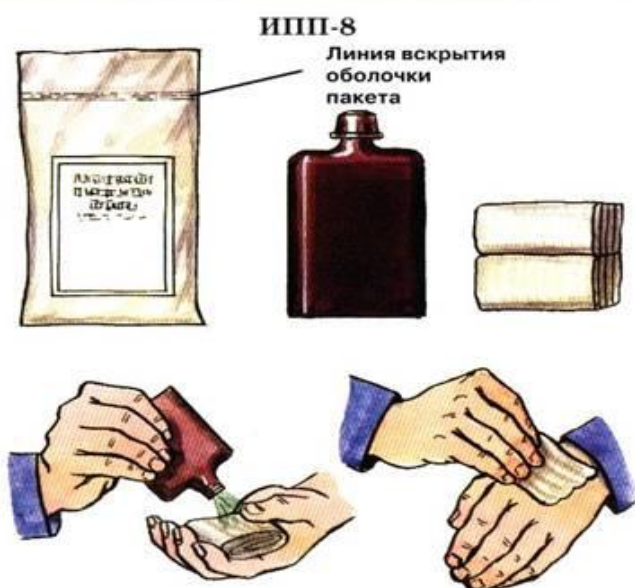
ИПП-8 Линия вскрытия оболочки пакета