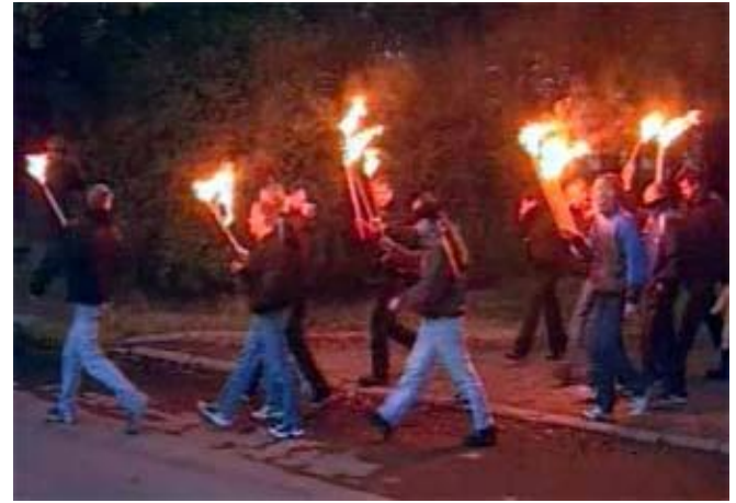
Скинхеды. Факельное шествие в Петербурге.