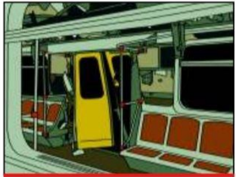
Вагон метро после взрыва, организованного террористами

Технологический терроризм заключается в применении или угрозе применения ядерного, химического или биологического оружия, радиоактивных и высокотоксичных химических, биологических веществ, а также угрозе захвата ядерных и иных промышленных объектов, представляющих повышенную опасность для жизни и здоровья людей.