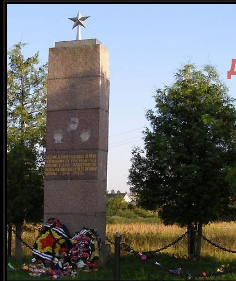
Памятник детям - узникам концлагеря в Вырице.