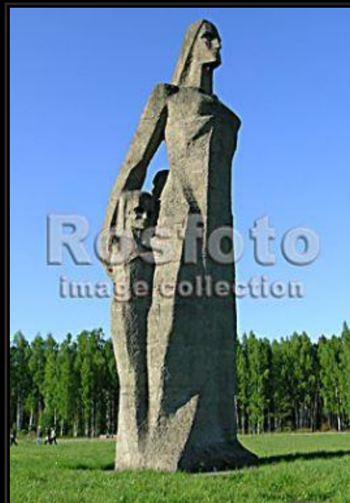
Памятник женщины с детьми – бывший концлагер ь в