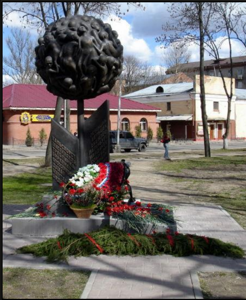
Памятник в г. Смоленске детям, погибшим в фашистских концлагерях во время