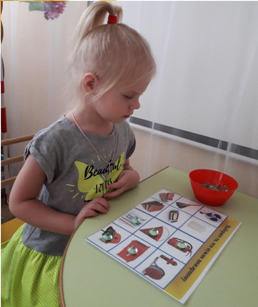
«Что нужно пожарному?»