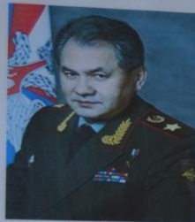
ШИБАЕВ СЕРГЕЙ НИКИТОВИЧ Министр обороны России Генерал-полковник