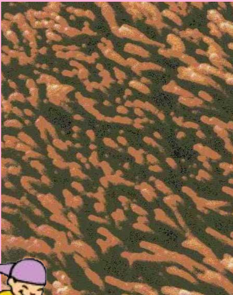
Легкие здорового человека