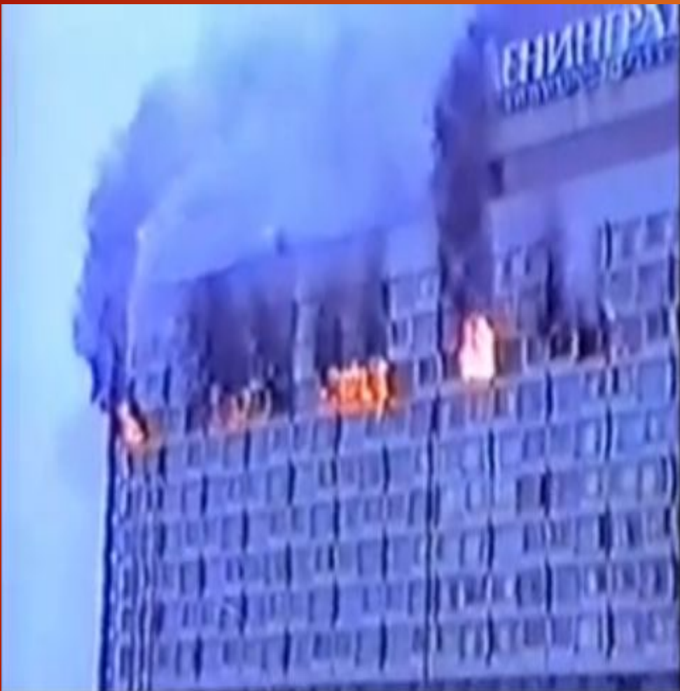
ПОЖАР В ГОСТИНИЦЕ ЛЕНИНГРАД

После смены власти обновлялись и правила безопасности. Однако полностью обеспечить жителям города покой не может никто. Так, в прошлом веке произошел пожар в гостинице «Санкт-Петербург», которая тогда носила название «Ленинград». Трагедия произошла 23 февраля 1991 года. О беде службу проинформировали только в 08:00 утра. До этого работники пытались бороться с огнем самостоятельно. Когда прибыли спасатели, горели лестницы и шахты лифтов. Поэтому многие постояльцы остались отрезанными от выходов. В результате погибло 16 невинных душ, 9 из которых - сами спасатели. Среди причин возгорания - поломка телевизора и замыкание проводов. Также рассматривалась версия поджога с целью уничтожения следов убийства.