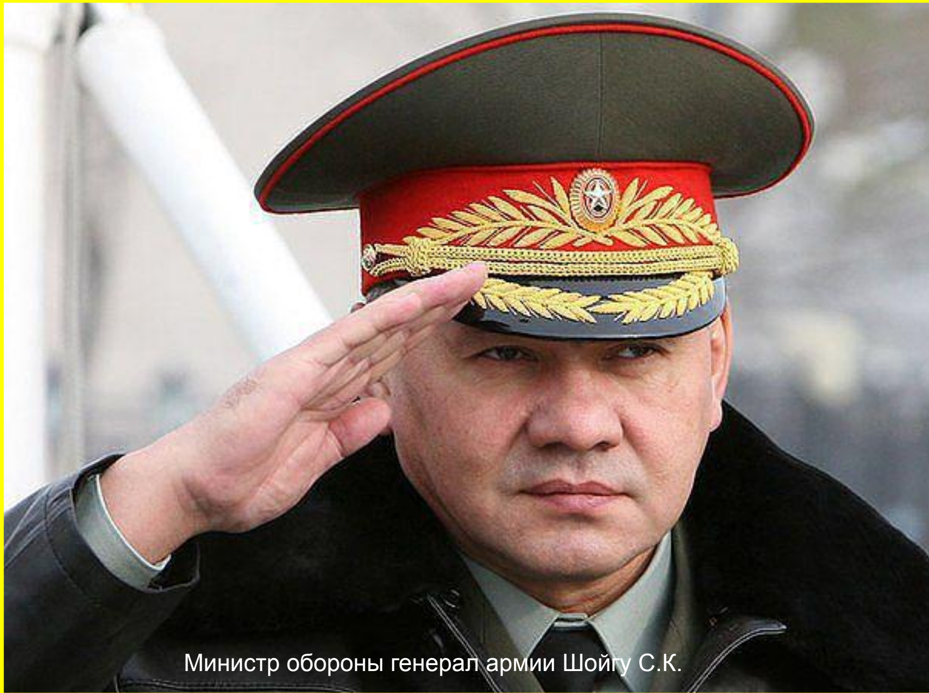
Министр обороны генерал армии Шойгу С.К.