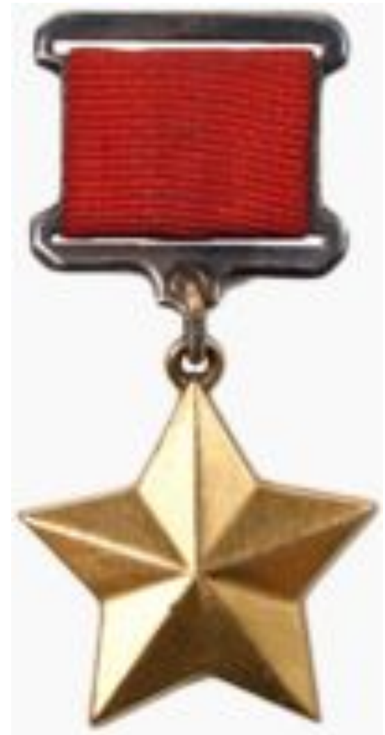
Медаль «Золотая Звезда» (СССР)