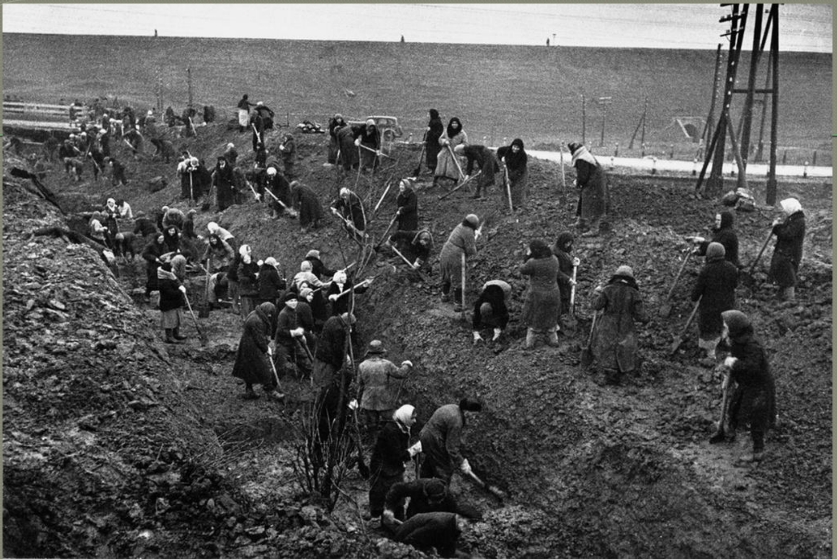
Рытье противотанковых рвов под Москвой сентябрь 1941 года