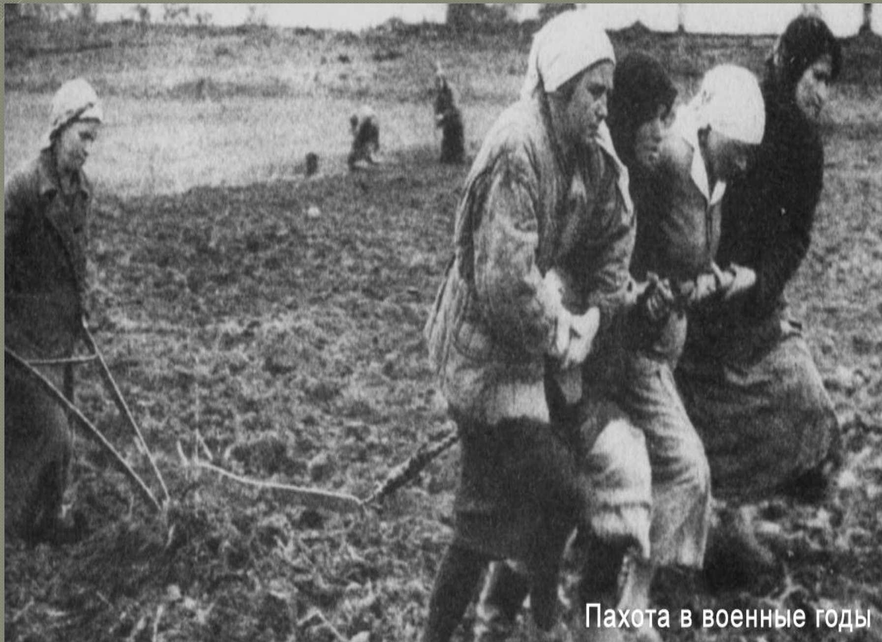
Пахота в военные годы