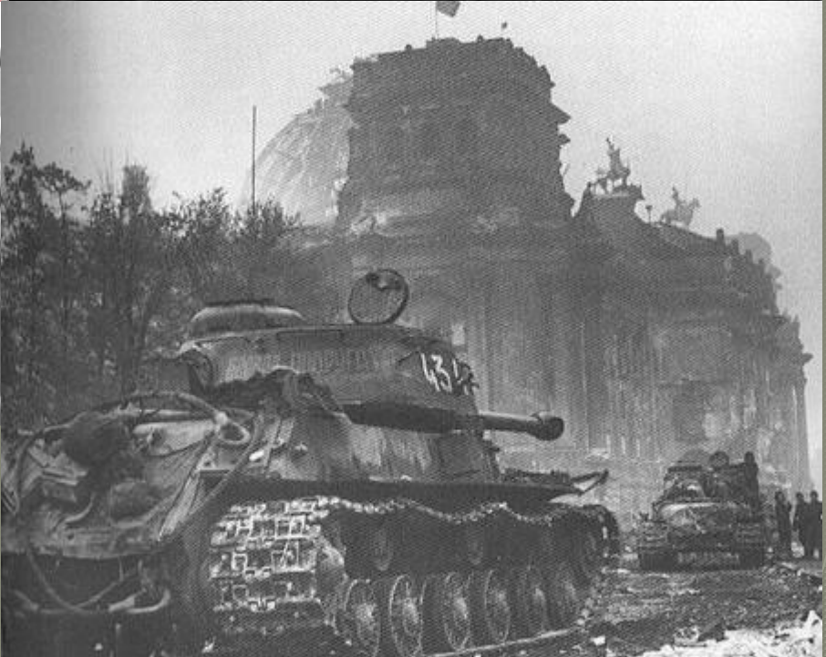
«Боевая подруга» Марии Октябрьской