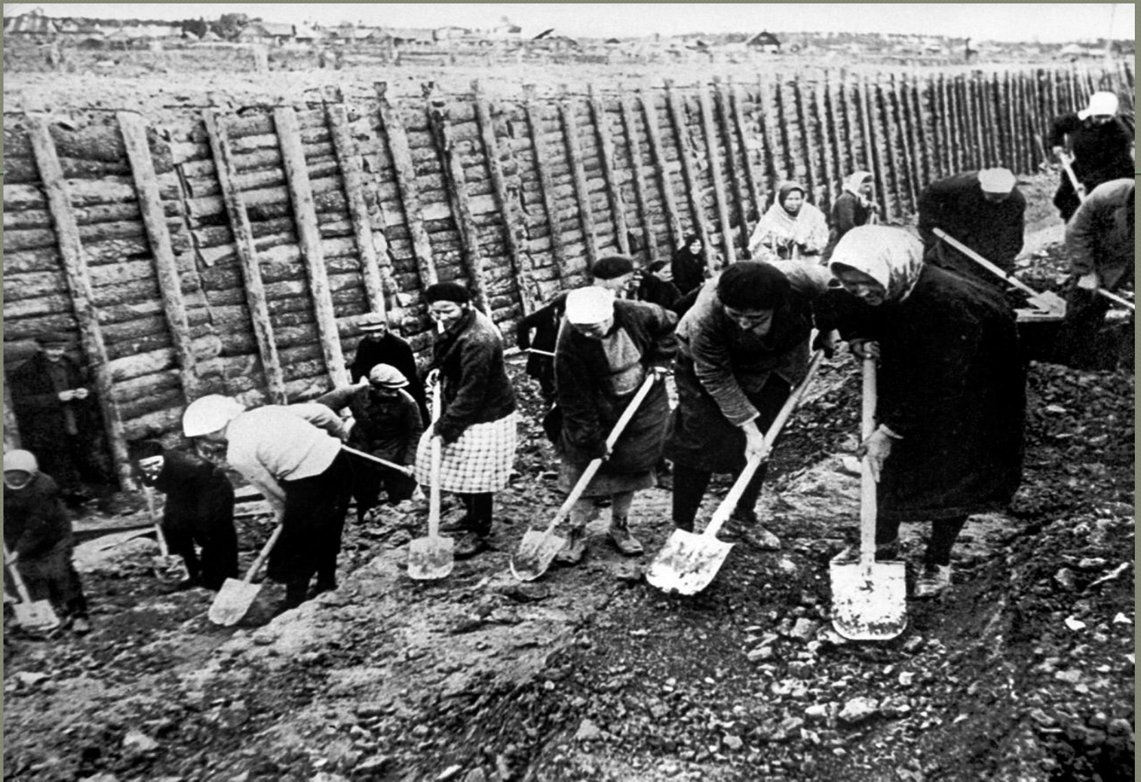
Оборонительные рубежи Ленинграда