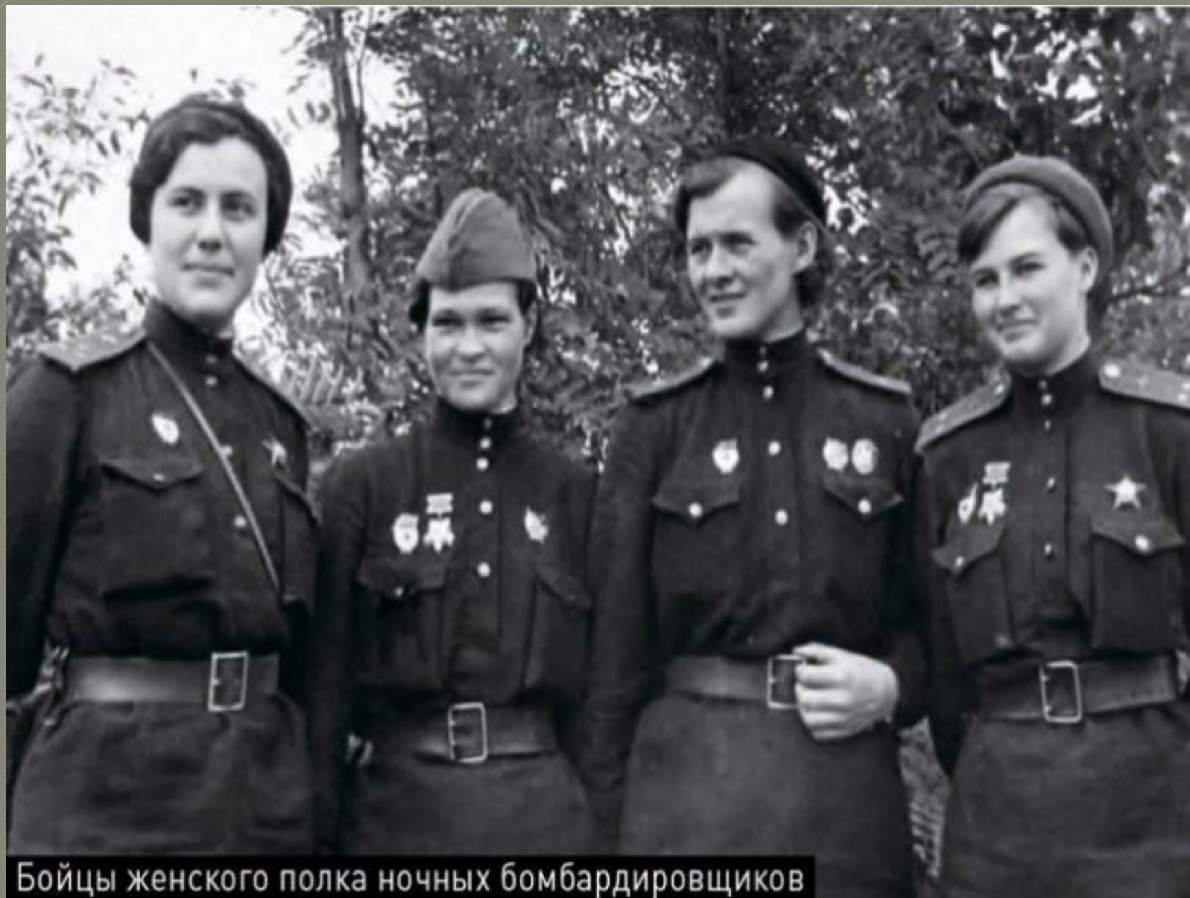
Бойцы женского полка ночных бомбардировщиков