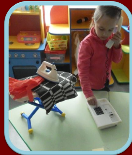
Фрагменты сюжетно- ролевой игры « Если возник пожар»