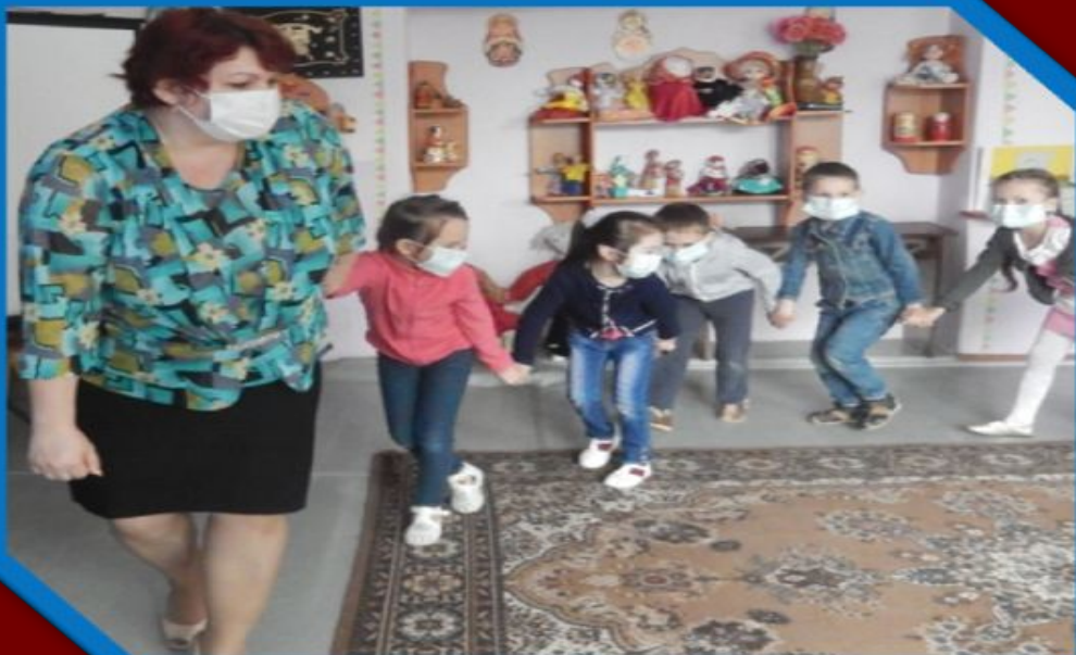
Подвижная игра « Действия при пожаре»; Составление свода Правил по ПББ