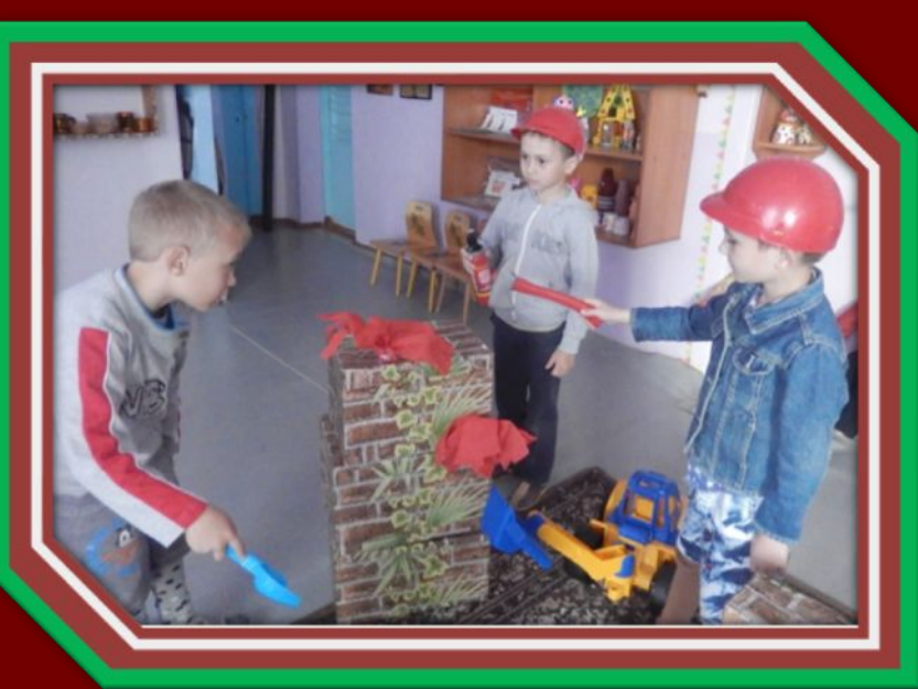
Фрагменты сюжетно- ролевой игры «Пожарные на учении»