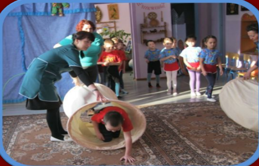
Тематическое развлечение « Огонь друг- огонь враг»

Закрепление знаний детей о действиях при пожаре на практике ( заключительный этап)