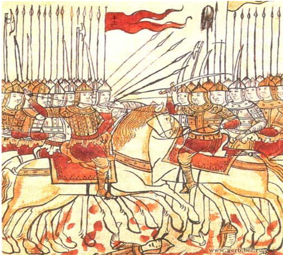
Битва на Куликовом поле. Миниатюра. XVI век.

С конца 14 века слово "стяг" стало постепенно заменяться словом "знамя". В свою очередь слово "знамя" происходит от старинного слова "знамение", которое имело смысл знаменовать, означать. В старинных рукописях впервые слово "знамя" (знамение) было применено к названию стяга Дмитрия Донского. В стрелецких войсках (середина 16 века) в каждом полку и в каждой сотне имелись свои знамена. Сотенные знамена именовались "меньшими" знаменами, а полковые - "большими".