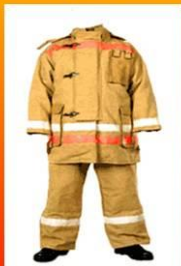
Боевая одежда пожарного