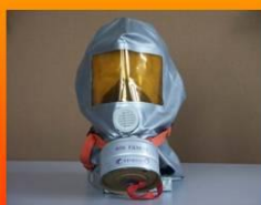
Маска - противогаз