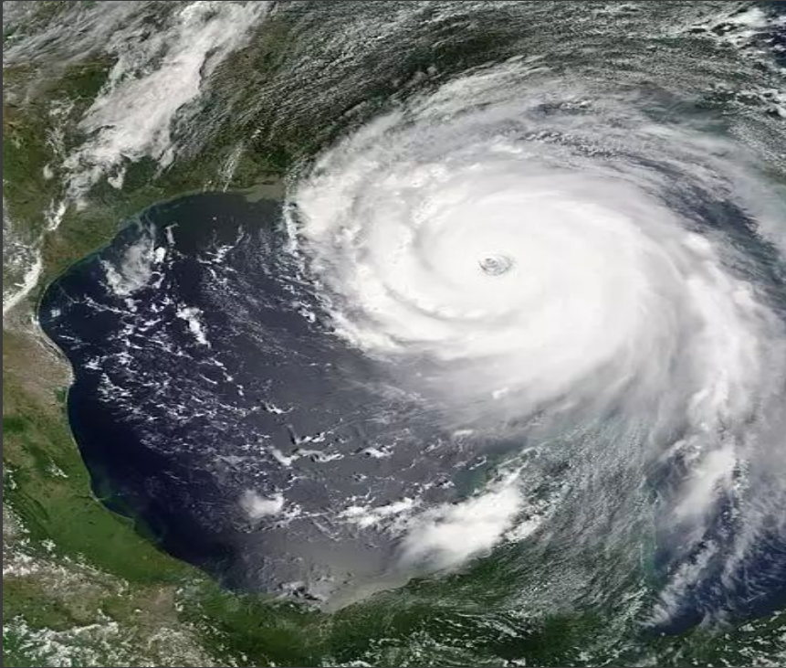
Hurricane Katrina August 25th, 2005 Ft. Lauderdale, FL

разрушительный ураган в истории США, который произошел в конце августа 2005 года. Скорость ветра во время урагана достигла 280 км/ч. Дамбы, которыми был защищен Новый Орлеан, оказались прорванными, началось затопление, под водой оказалось около 80 % площади города. В результате стихийного бедствия погибло 1836 человек, экономический ущерб составил 125