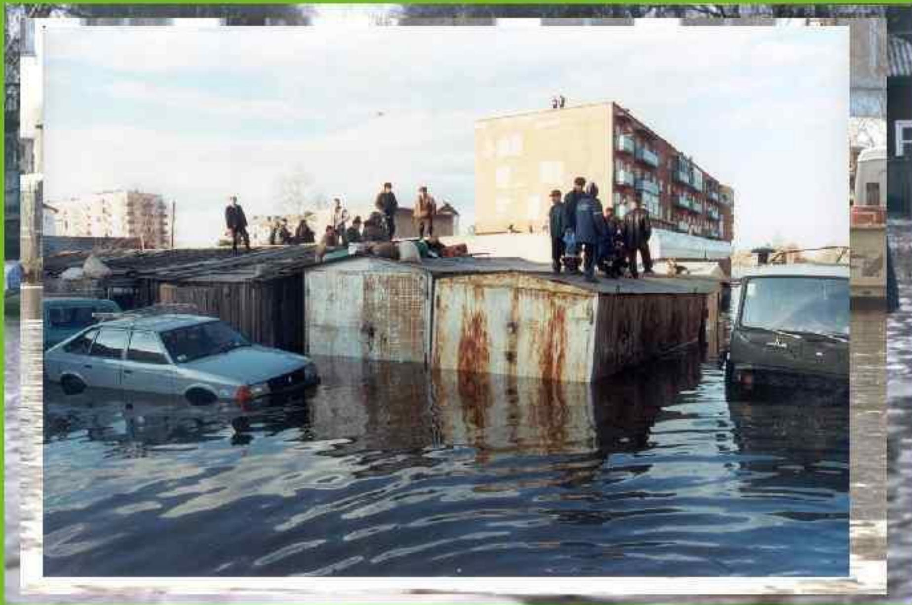
НАВОДНЕНИЕ В ЛЕНСКЕ – 2001 г.