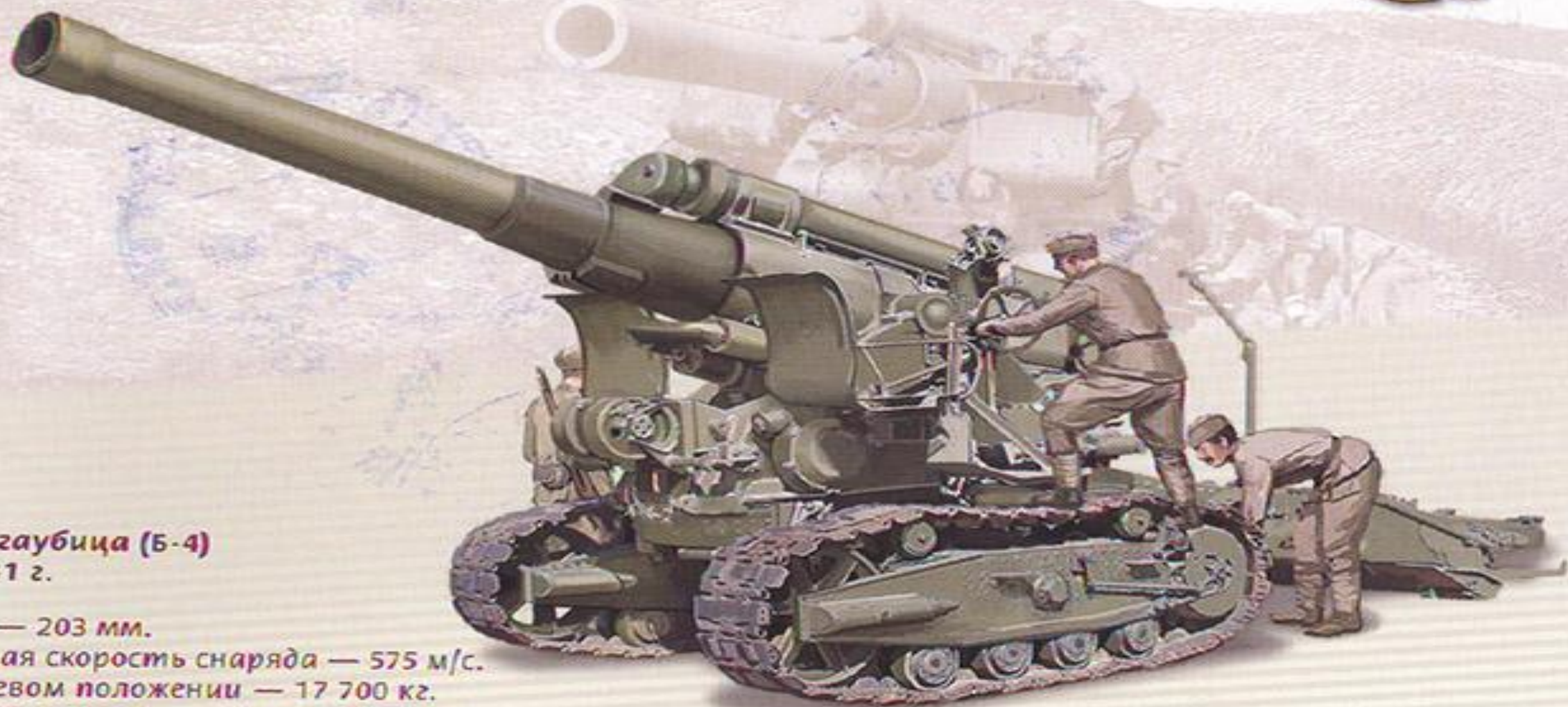
203-мм гаубица (Б-4) обр. 1931 г.