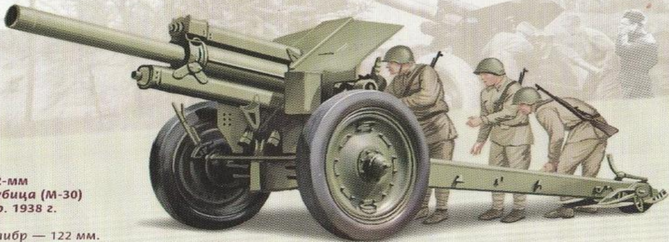
122-мм гаубица (М-30) обр. 1938 г.