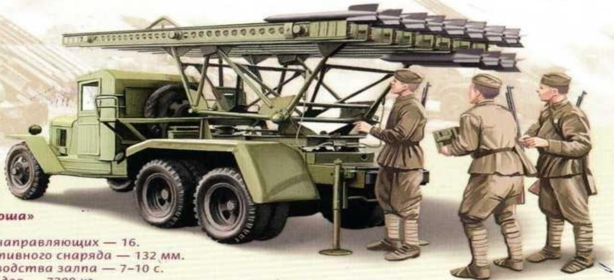
Реактивная установка БМ-13 «Катюша»

Количество направляющих — 16. Калибр реактивного снаряда — 132 мм. Время производства залпа — 7–10 с. Вес без снарядов — 7200 кг, вес со снарядами — 7880 кг. Дальность стрельбы — 8470 м.