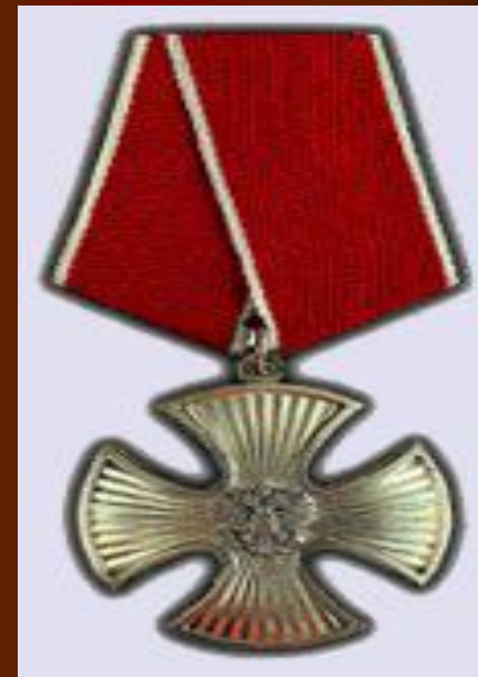
орден "За заслуги перед Отечеством"