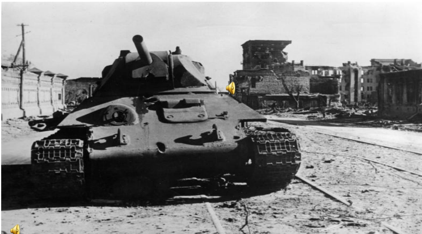
Bundesarchiv, Bild 183-B22359 Foto: Herber | Oktober 1942