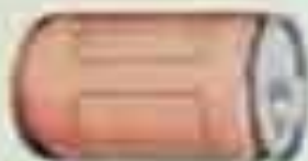
Пивная банка 0,33 л