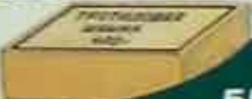
Шашка массой 400 г