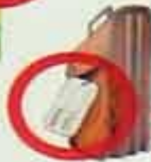
БЕСХОЗНЫЕ СУМКИ, ПОРТФЕЛИ, ПАКЕТЫ