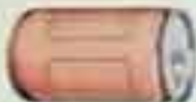
Пивная банка 0,33 л