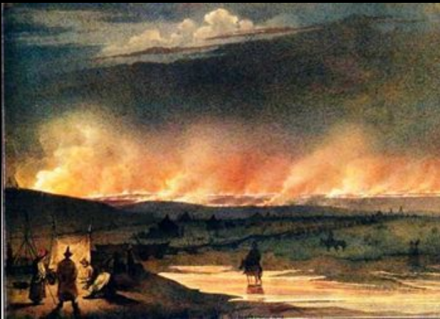
Т. Шевченко «Пожежа в степу»

Зображення вогню в живописі, були і є вічною темою. Вогонь – це антипод води. На картинах він присутній у повній мірі: це і зображення факелів, свічок, вогняних коней, це й пожежі, які протягом століть знищували все на своєму шляху. Вогонь для художника – це передусім першоджерело всього сущого, символ пізнання і руху.