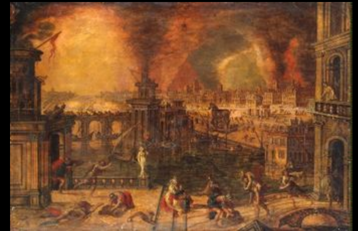
Керстіан де Кейнінк «Вогонь у Трої»