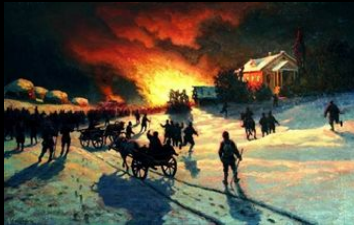
Юхим Волкова «Пожежа»