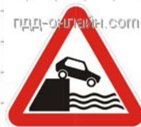
1.10 Выезд на набережную