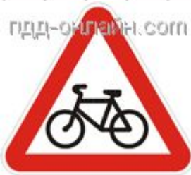
1.24 Пересечение с велосипедной дорожкой