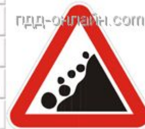
1.28 Падение камней