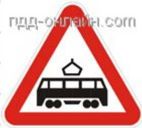
1.5 Пересечение с трамвайной линией