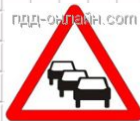
1.32 Затор Применяется в качестве временного или в знаках с изменяемым изображением перед перекрестком, откуда возможен объезд участка дороги, на котором образовался затор.