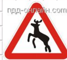
1.27 Дикие животные