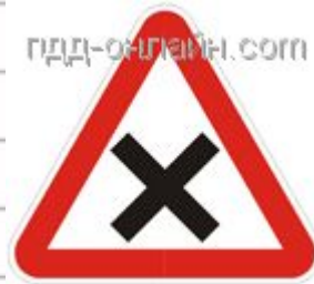
1.6 Пересечение равнозначных дорог