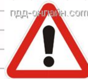
1.33 Прочие опасности Участок дороги, на котором имеются опасности, не предусмотренные другими предупреждающими знаками.