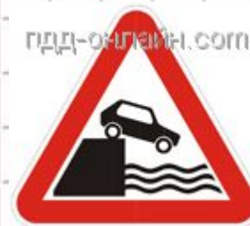
1.10 Выезд на набережную