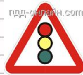
1.8 Светофорное регулирование