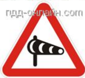
1.29 Боковой ветер