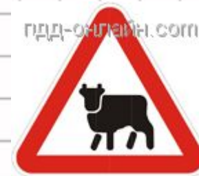
1.26 Перегон скота