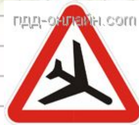
1.30 Низколетающие самолеты