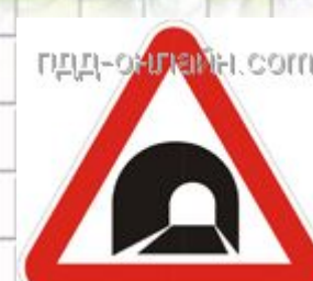
1.31 Тоннель Тоннель, в котором отсутствует искусственное освещение, или тоннель, видимость въездного портала которого ограничена.