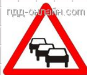
1.32 Затор Применяется в качестве временного или в знаках с изменяемым изображением перед перекрестком, откуда возможен объезд участка дороги, на котором образовался затор.