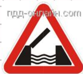
1.9 Разводной мост