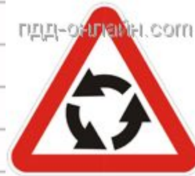
1.7 Пересечение с круговым движением