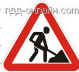
1.25 Дорожные работы При проведении краткосрочных работ на проезжей части может быть установлен (без таблички 8.1.1) на расстоянии 10—15 м до места проведения работ. Повторяются вне населенных и в населенных пунктах непосредственно в начале опасного участка.