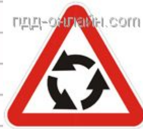
1.7 Пересечение с круговым движением