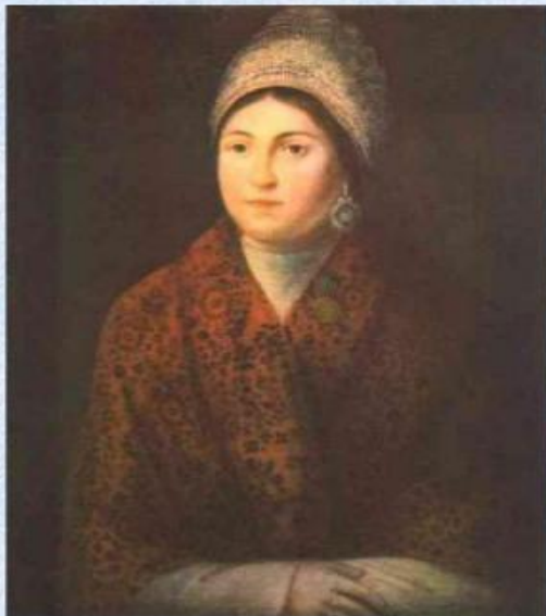
А. Смирнов. «Портрет Василисы Кожиной» (1813)