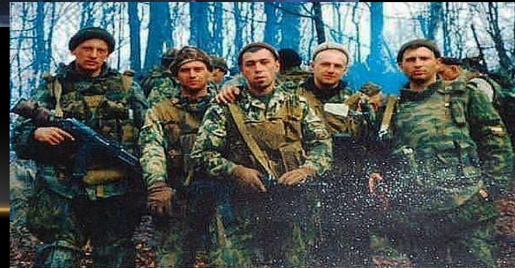
С 29 февраля по 1 марта 2000 года бойцы 6 роты вели бой на высоте 776. Соотношение численности было 90 против 2500. В живых остались шестеро.