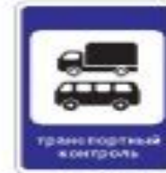
7.14 Пункт контроля международных автомобильных перевозок