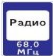
7.15 Зона приема радиостанции, передающей информацию о дорожном движении