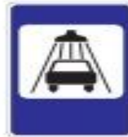
7.5 Мойка автомобилей