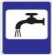
7.8 Питьевая вода