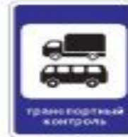
7.14 Пункт контроля международных автомобильных перевозок