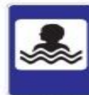
7.17 Бассейн или пляж