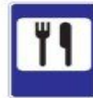
7.7 Пункт питания