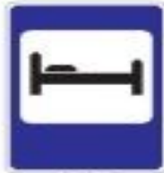
7.9 Гостиница или мотель