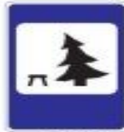
7.11 Место отдыха