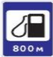
7.3 Автозаправочная станция