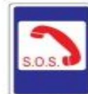
7.19 Телефон экстренной связи