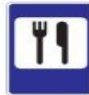
7.7 Пункт питания