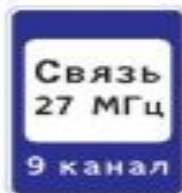
7.16 Зона радиосвязи с аварийными службами