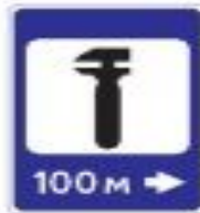
7.4 Техническое обслуживание автомобилей