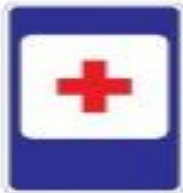
7.1 Пункт первой медицинской помощи