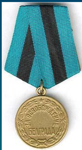
Медаль "За освобождение Белграда"