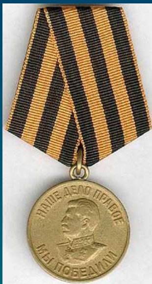
Медаль "За победу над Германией в Великой Отечественной войне 1941-1945 гг"