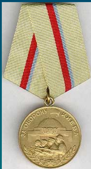
Медаль "За оборону Киева"