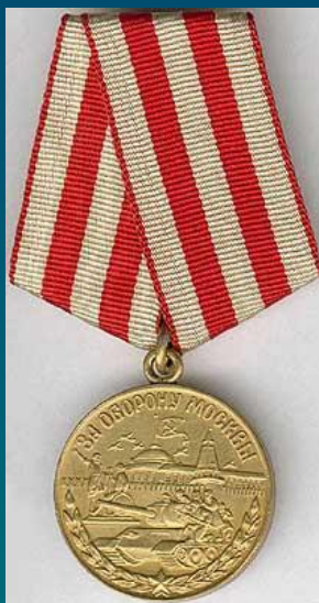
Медаль "За оборону Москвы"