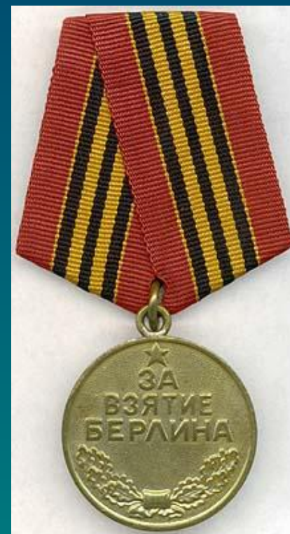
Медаль "За взятие Берлина"