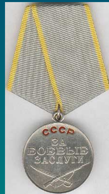
Медаль "За боевые заслуги"