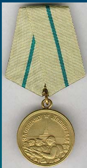
Медаль "За оборону Ленинграда"