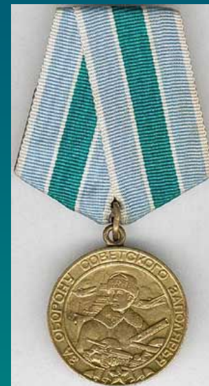
Медаль "За оборону Советского Заполярья"