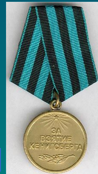
Медаль "За взятие Кенигсберга"