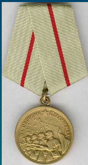
Медаль "За оборону Сталинграда"