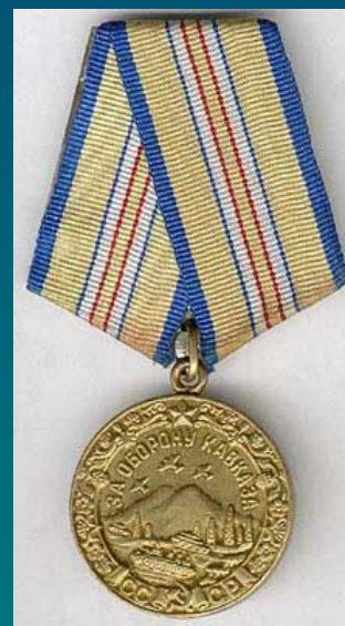
Медаль "За оборону Кавказа"