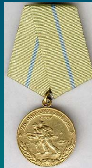
Медаль "За оборону Одессы"