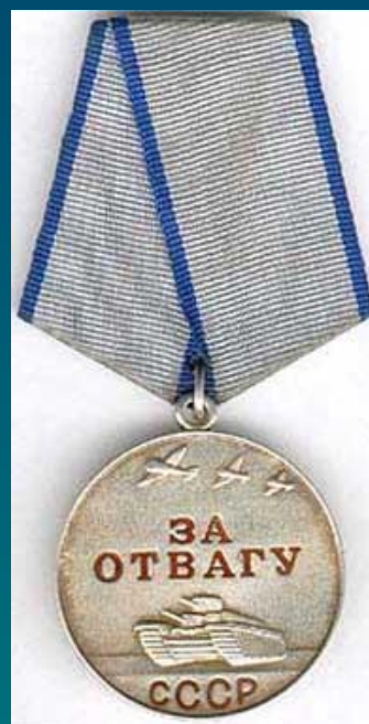
Медаль "За отвагу"