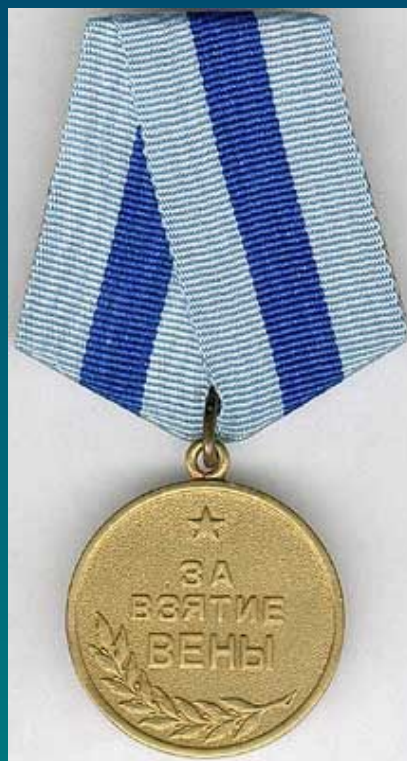
Медаль "За взятие Вены"