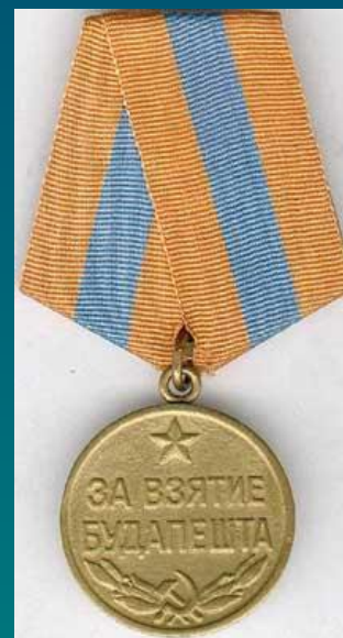
Медаль "За взятие Будапешта"