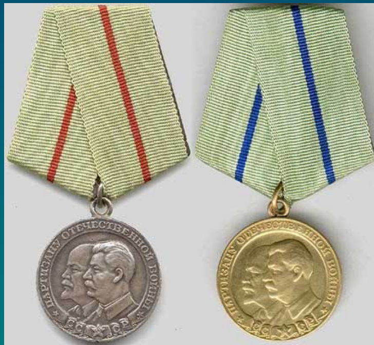
Медаль «Партизану Отечественной войны»