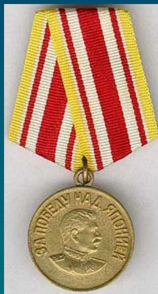
Медаль "За победу над Японией"