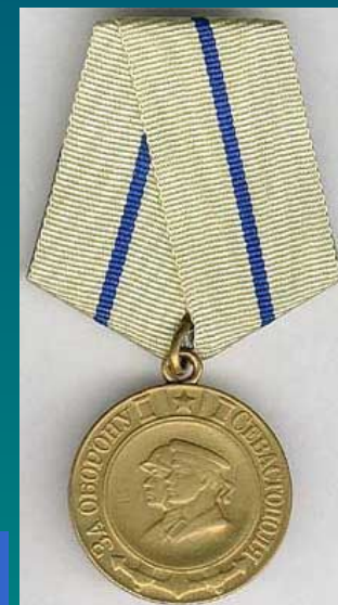
Медаль "За оборону Севастополя"