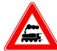
Железнодорожный переход без шлагбаума