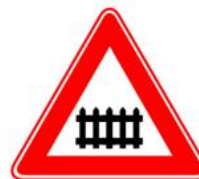
Железнодорожный переход со шлагбаумом