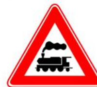
Железнодорожный переезд без шлагбаума