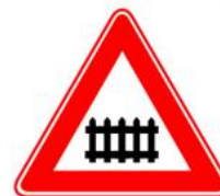
Железнодорожный переезд со шлагбаумом