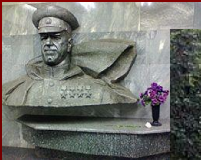
Бюст Жукова в метро Харькова