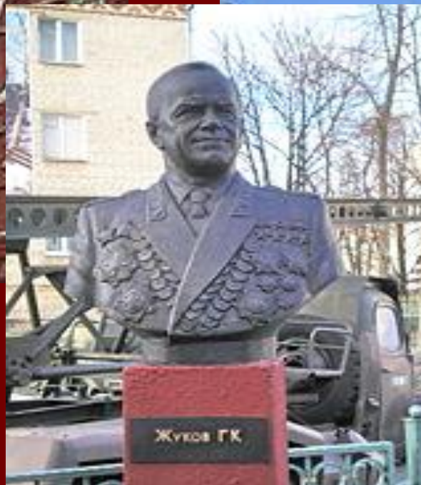
Бюст Жукова в Гомеле