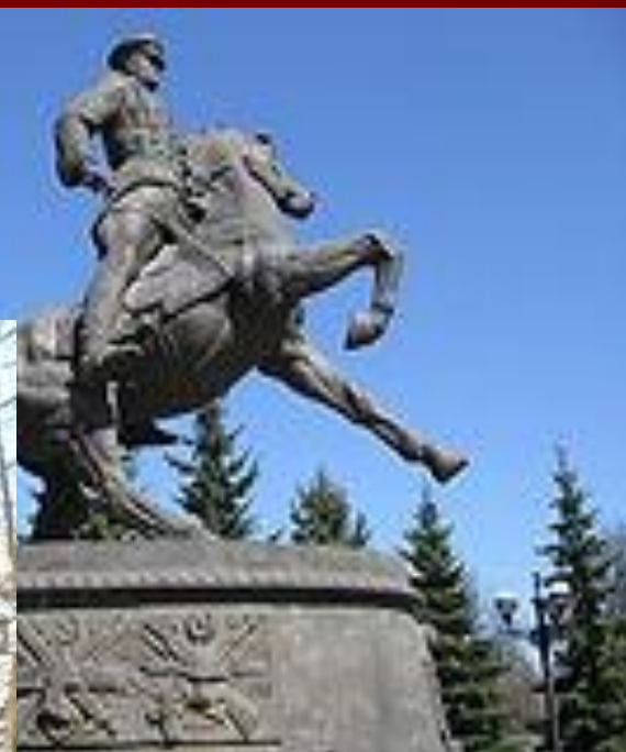
Памятник Жукову в Екатеринбурге