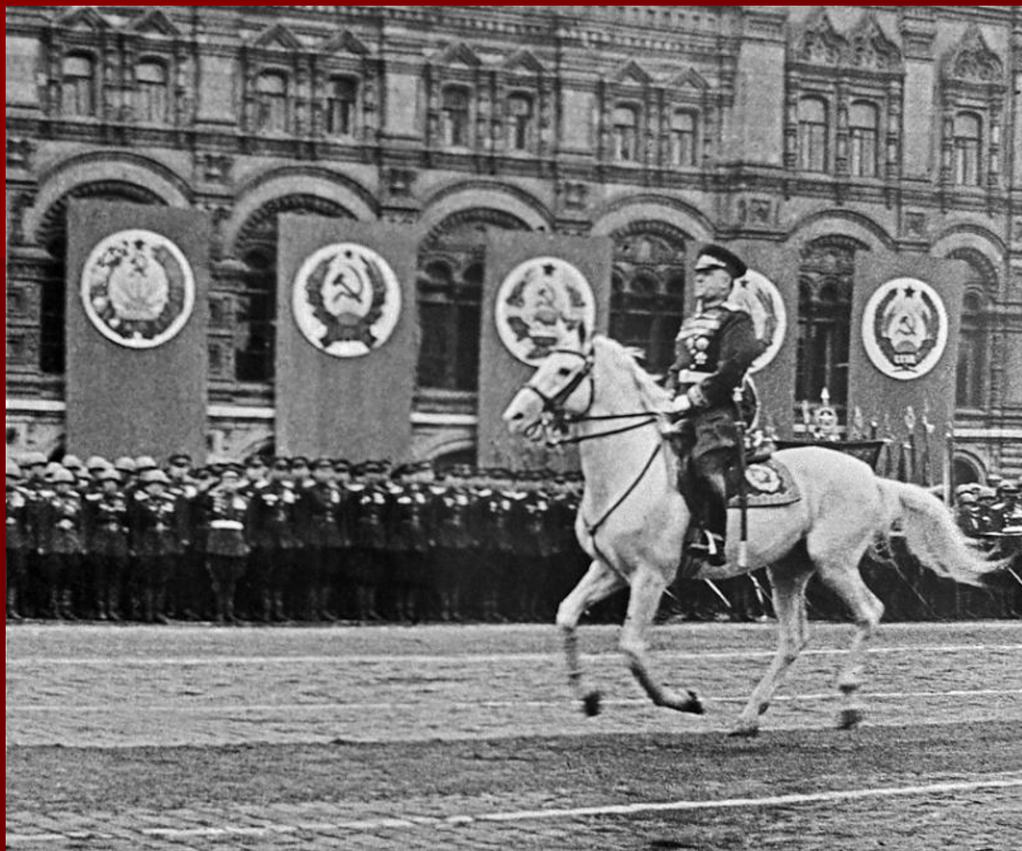
Маршал Жуков принимает триумфальный Парад Победы в Москве 24 июня 1945 г.