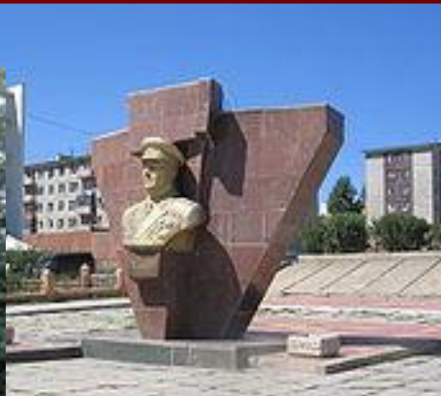
Памятник Жукову в Улан - Баторе (Монголия)