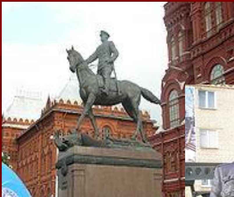
Памятник Жукову в Москве. Скульптор В.М. Клыков