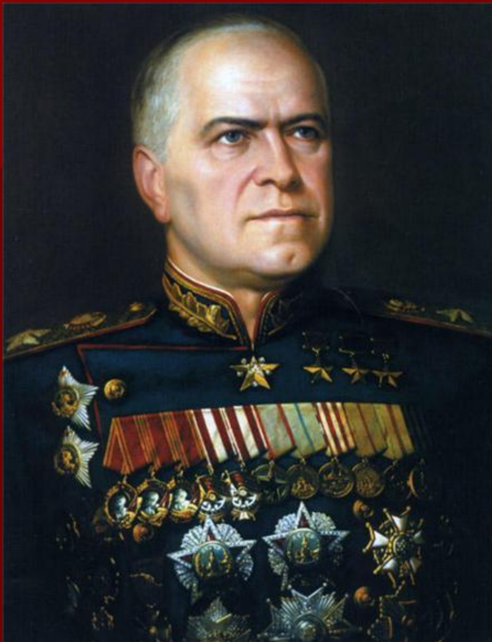
Георгий Константинович Жуков