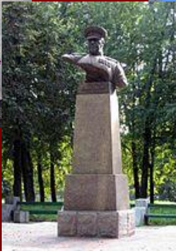
Памятник Жукову в Минске