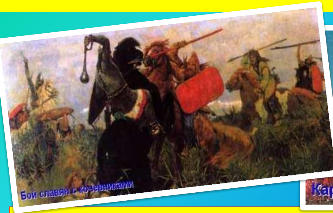
Бои славян с кочевниками