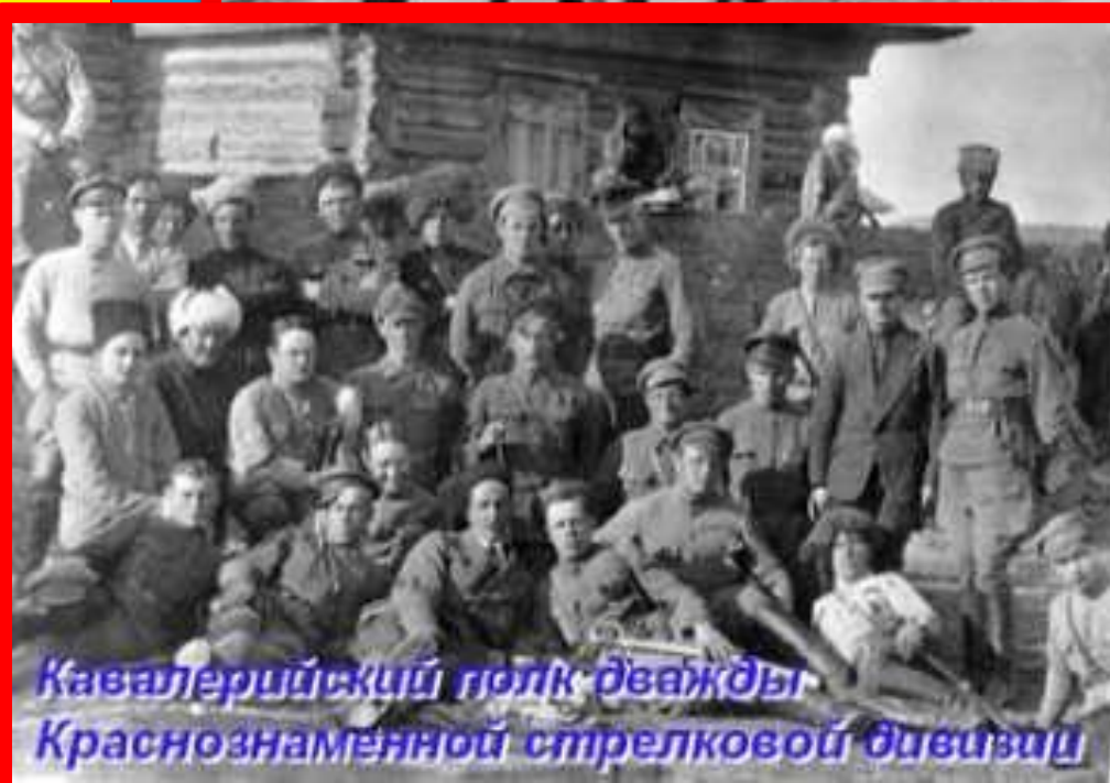
Кавалерийский полк дважды Краснознаменной стрелковой дивизии