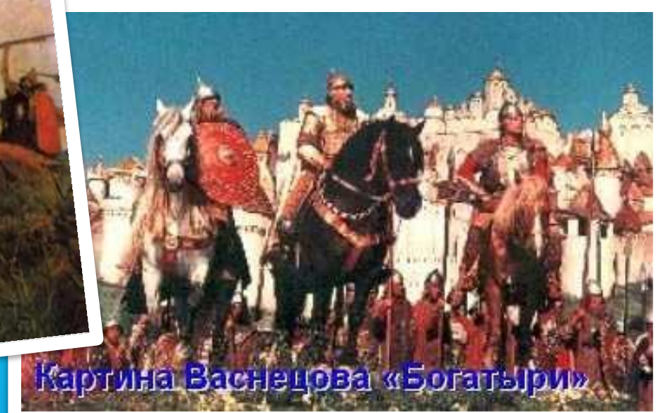
Картина Васнецова «Богатыри»