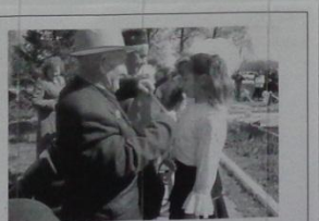
Ветераны и наследники