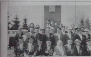
Ветераны войны и тыла