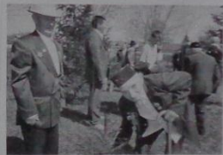
9 мая - День Победы