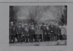
Последние солдаты Великой войны