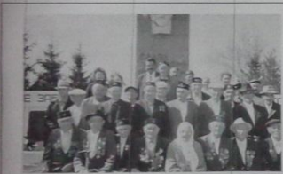
Ветераны войны и тыла