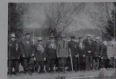
Последние солдаты Великой войны