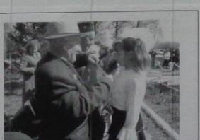
Ветераны и наследники