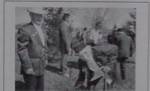
9 мая - День Победы