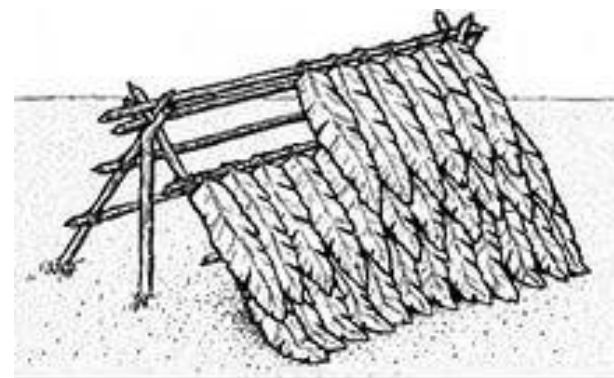
Figure VI-10. Shingle Method