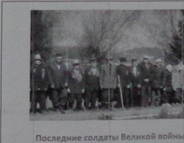
Последние солдаты Великой войны