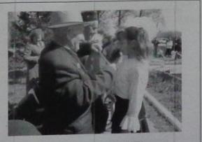
Ветераны и наследники