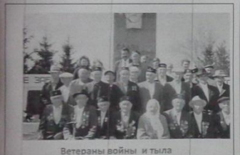
Ветераны войны и тыла