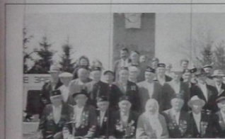
Ветераны войны и тыла