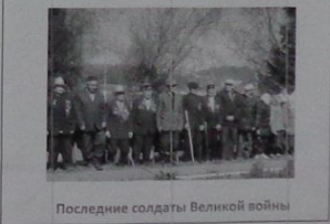
Последние солдаты Великой войны