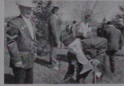
9 мая - День Победы