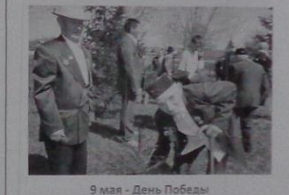
9 мая - День Победы