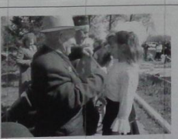
Ветераны и наследники