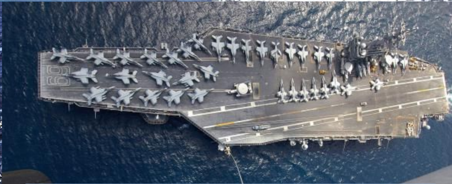
Авианосец «Адмирал Кузнецов»