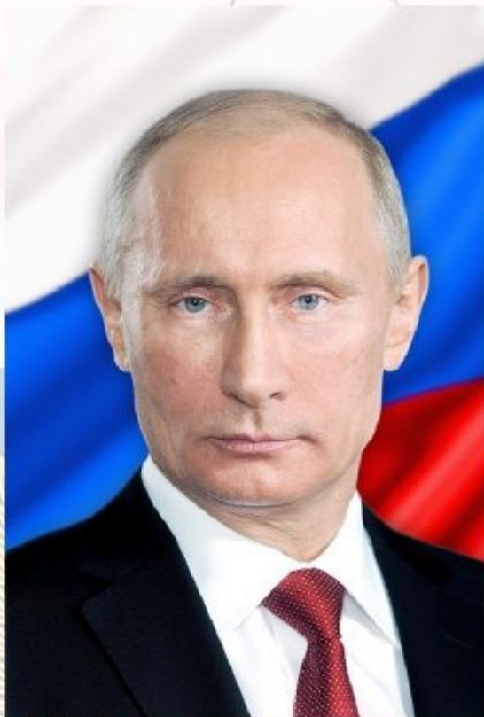
Верховный главнокомандующий Вооружёнными силами Российской Федерации Владимир Владимирович Путин.