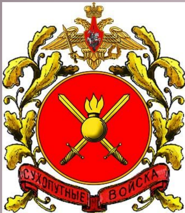
Большая эмблема СВ