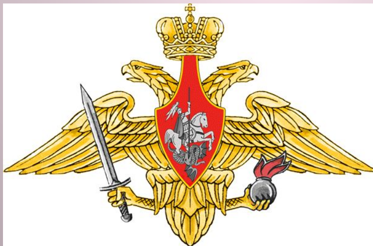
Средняя эмблема СВ