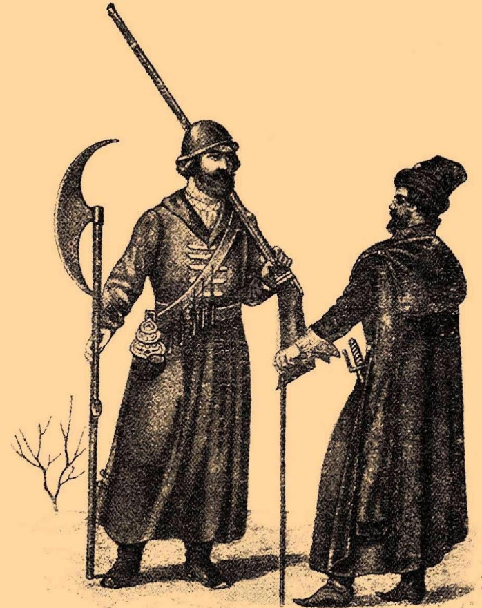
Стрѣлецъ (рядовой). Начало XVII столѣтія.