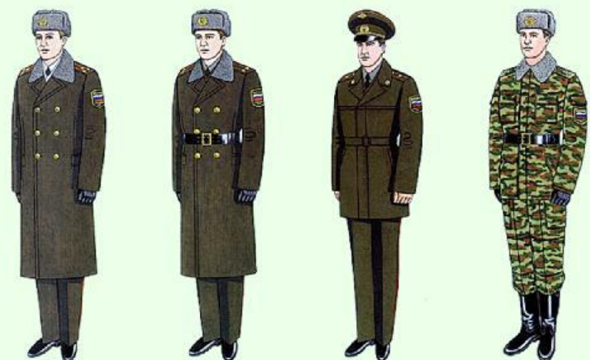
Парадная для строя и вне строя