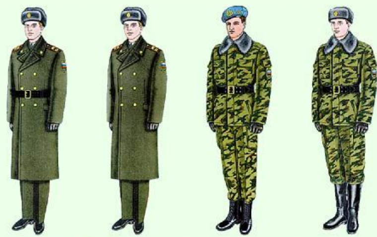
Парадная для строя