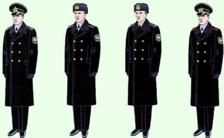
Парадная для строя и вне строя