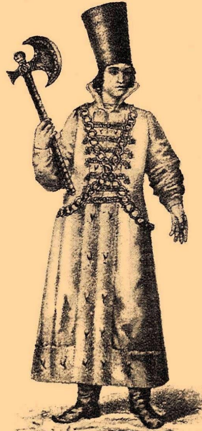
Рында XVI—XVII стол.