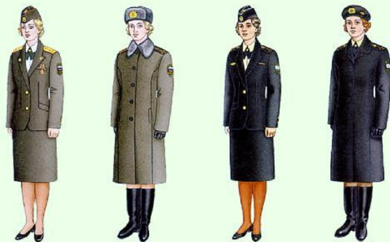
Летняя парадная для строя и вне строя (кроме ВМФ)