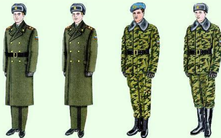
Парадная для строя