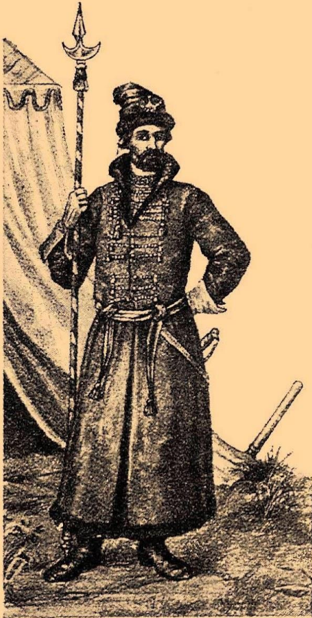
Пеший жилец XVI—XVII стол.