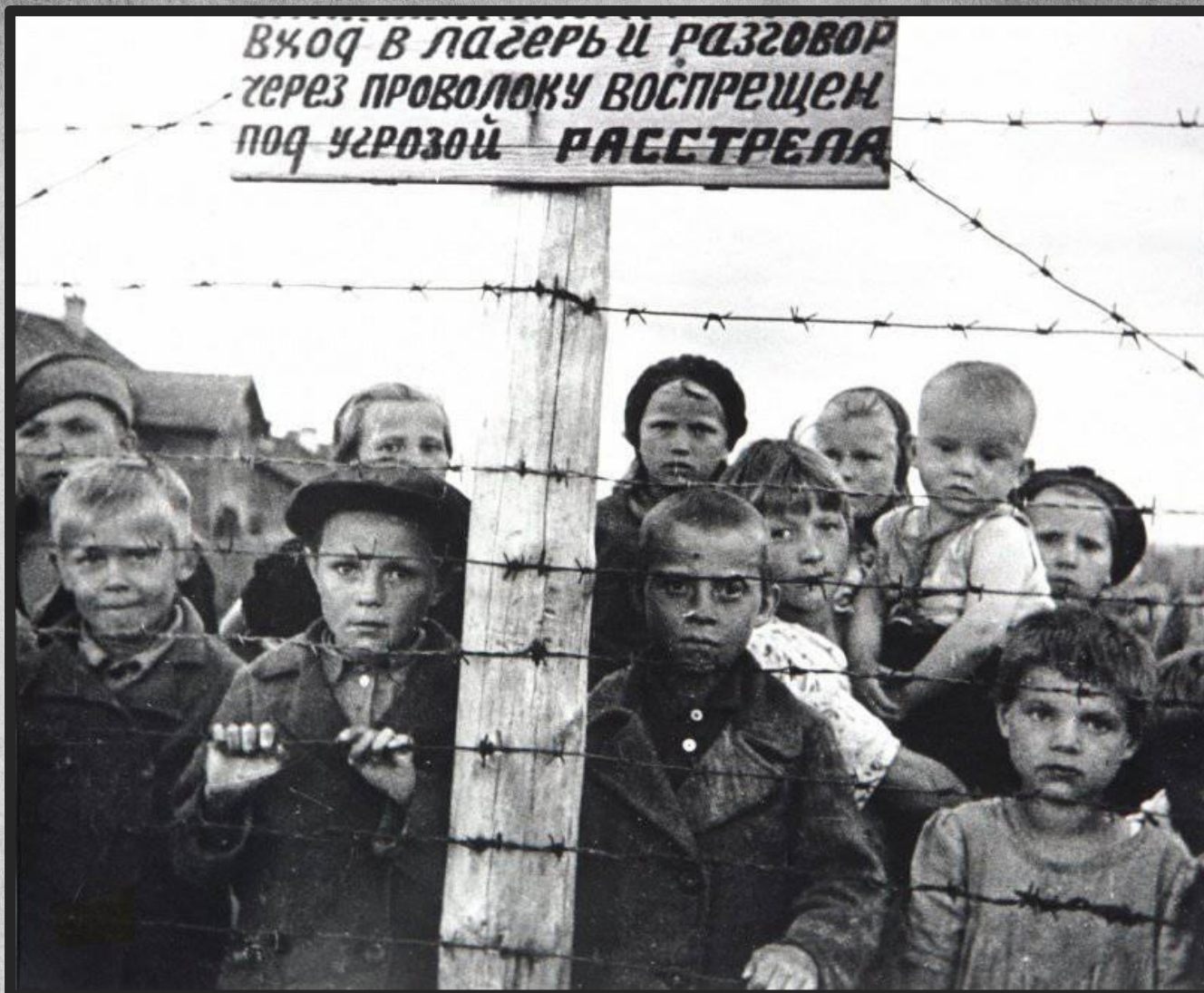
Советские дети-узники 6-го финского концлагеря в Петрозаводске. Во время оккупации Советской Карелии финнами в Петрозаводске было создано шесть концлагерей для содержания местных русскоязычных жителей. Лагерь №6 размещался в районе Перевалочной биржи, в нем держали 7000 человек.