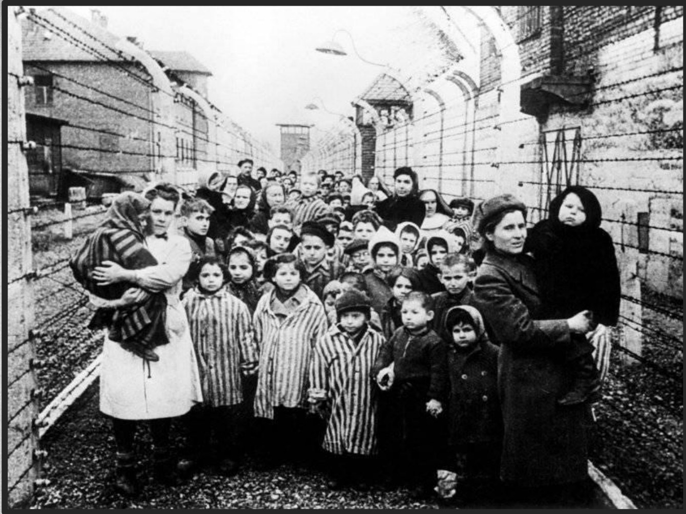
Освобожденные дети из концлагеря Освенцим.