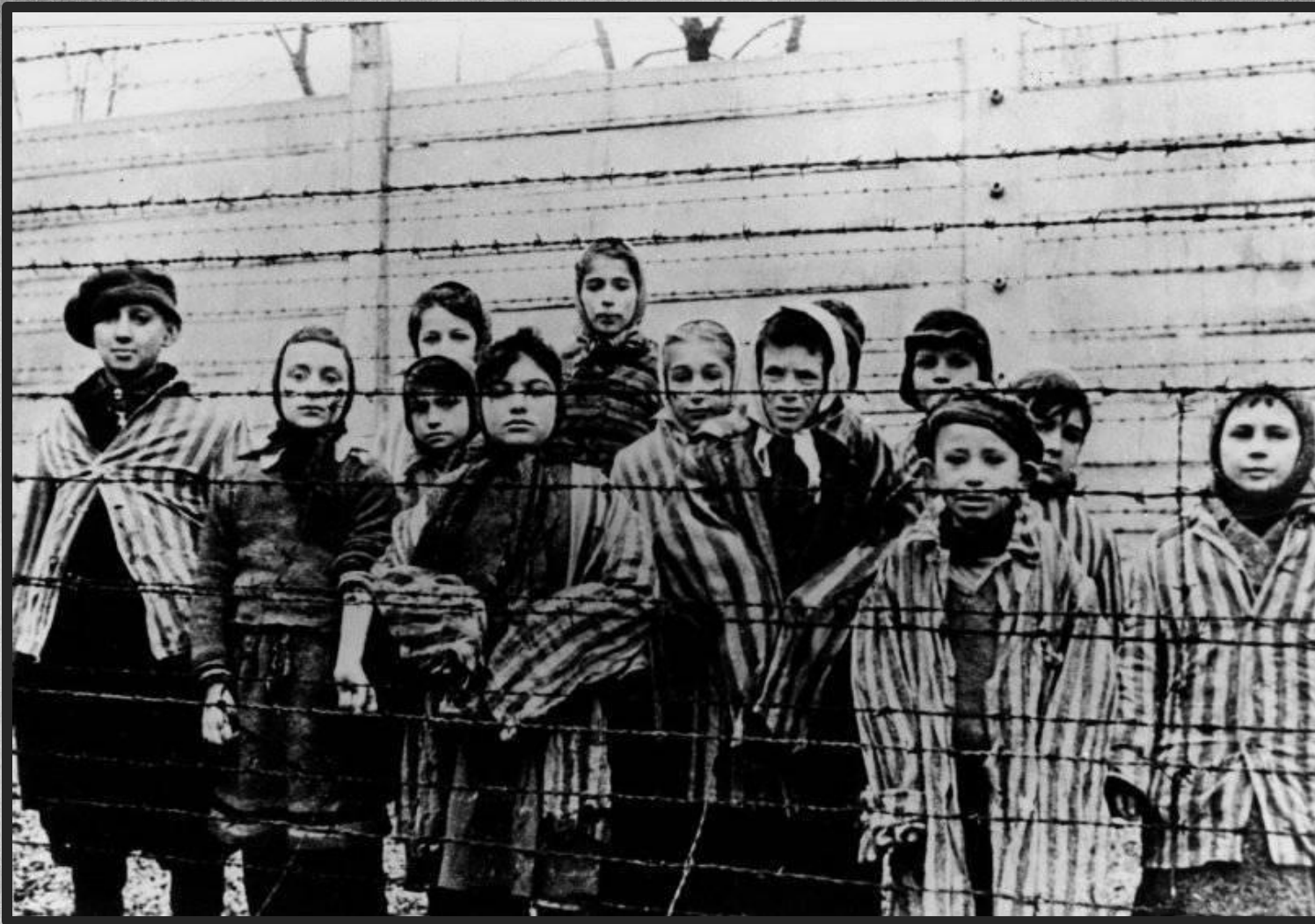
Группа детей, освобождённых из концлагеря Освенцим (Аушвиц). Всего из лагеря было освобождено около 7500 человек, включая детей. Около 50 тысяч заключённых немцы успели вывезти из Освенцима в другие лагеря до приближения частей Красной армии.