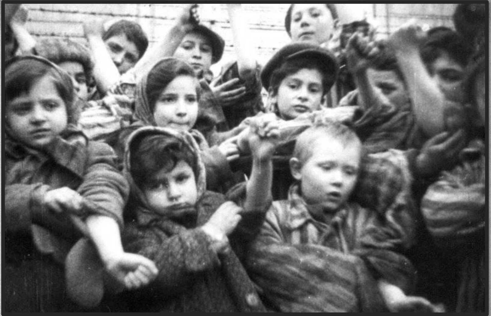
Освобожденные дети, заключённые концлагеря Освенцим (Аушвиц) показывают лагерные номера, вытатуированные на руках.