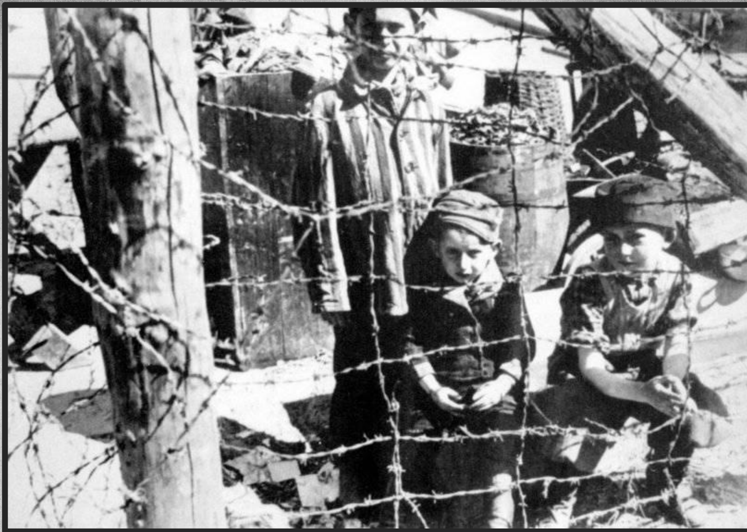
Дети за колючей проволокой в концлагере Бухенвальд после его освобождения.