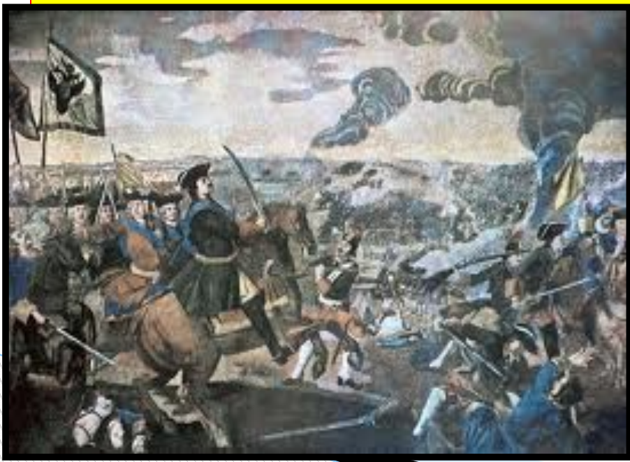
А. С. Пушкин. Полтавская битва