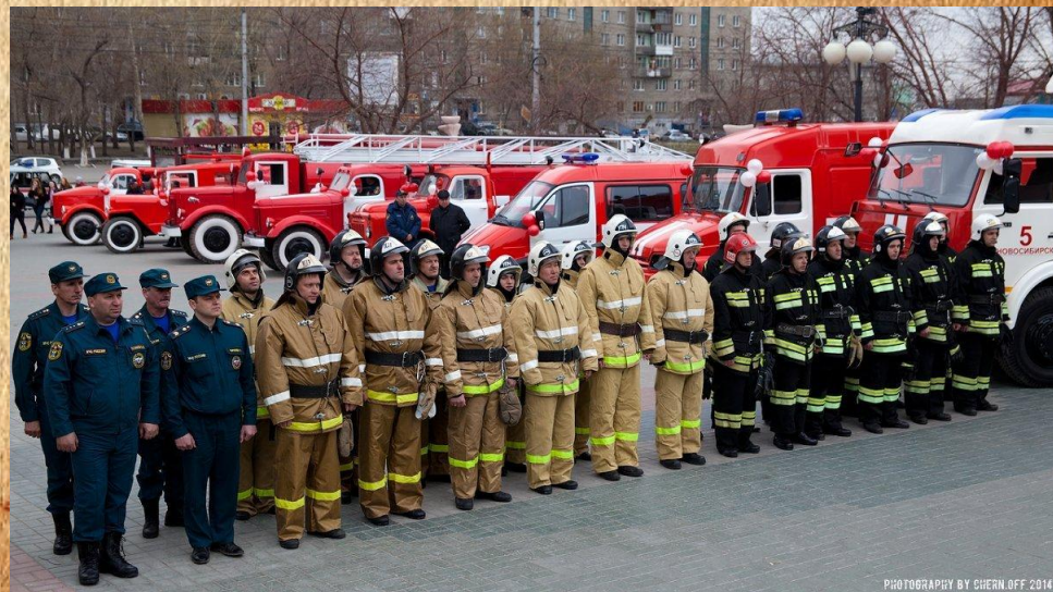
PHOTOGRAPHY BY CHERN OFF 2014