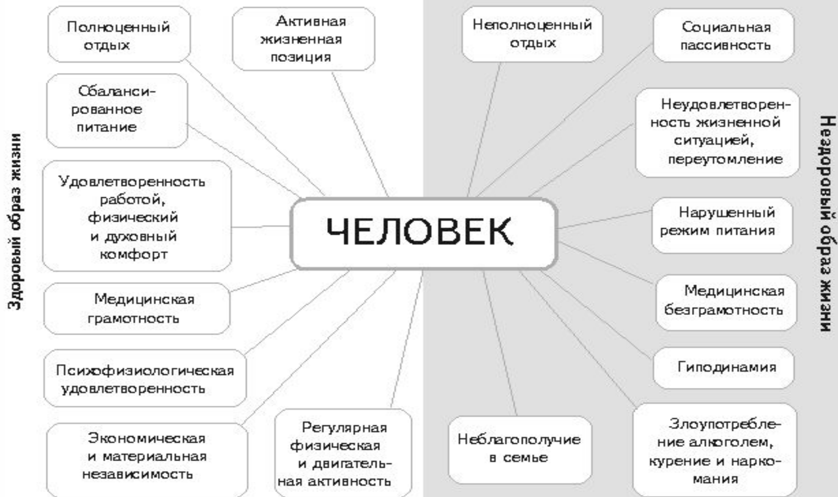
Схема «Здоровый образ жизни»