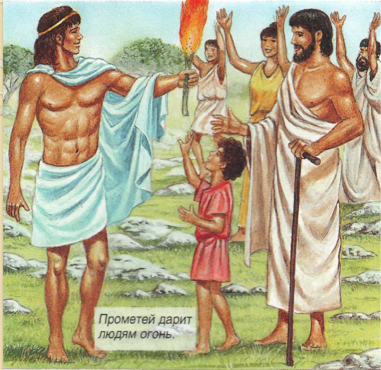
Прометей дарит людям огонь.