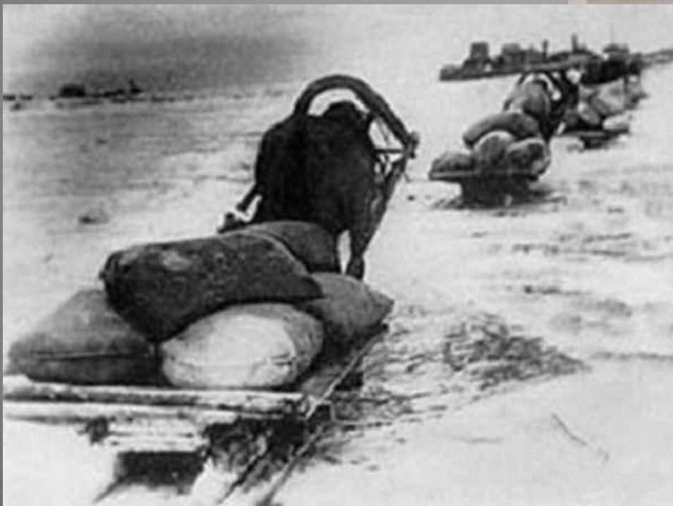
«Ладжское озеро, называлась «гниль», была единственной лучшей посаженный город с юней в 1942 году было око сот тысяч горожан.