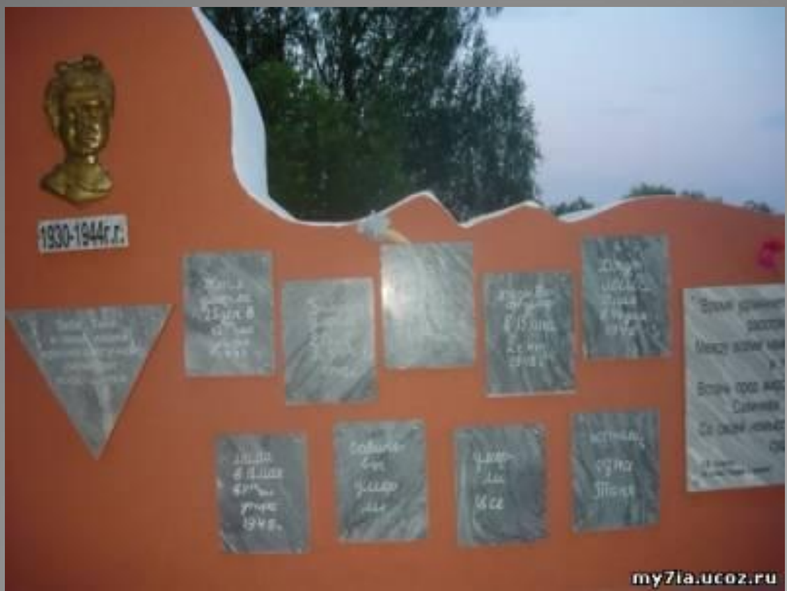
Рядом - возведенная в 1975 году стела с барельефным портретом Тани Савичевой и страничками из ее дневника.