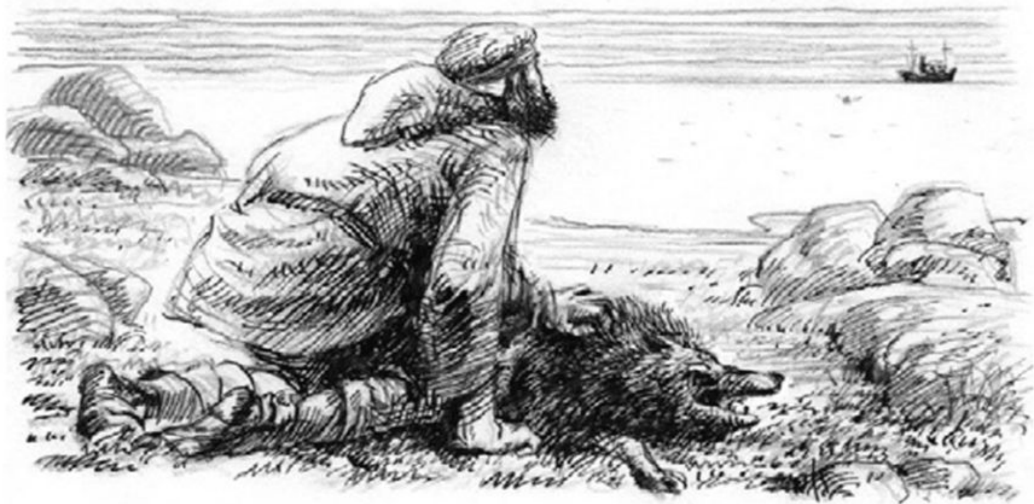
Ю. Шейнис. Иллюстрация к рассказу Джека Лондона «Любовь к жизни». 2006 г.