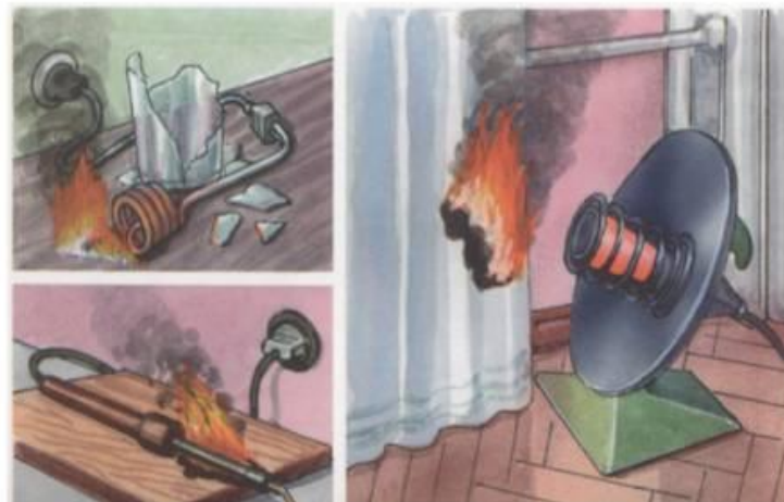
Оставление без присмотра электрических нагревательных приборов