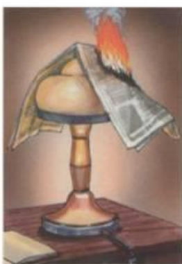
Затемнение электроламп сгораемыми материалами (бумагой, тканью)