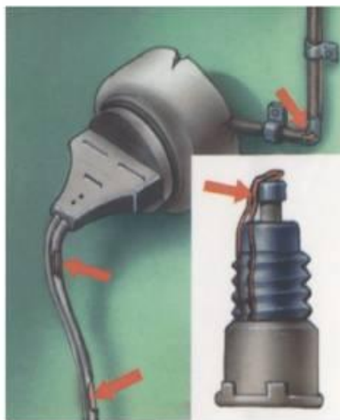
Неисправность электропроводки Пользование самодельными предохранителями