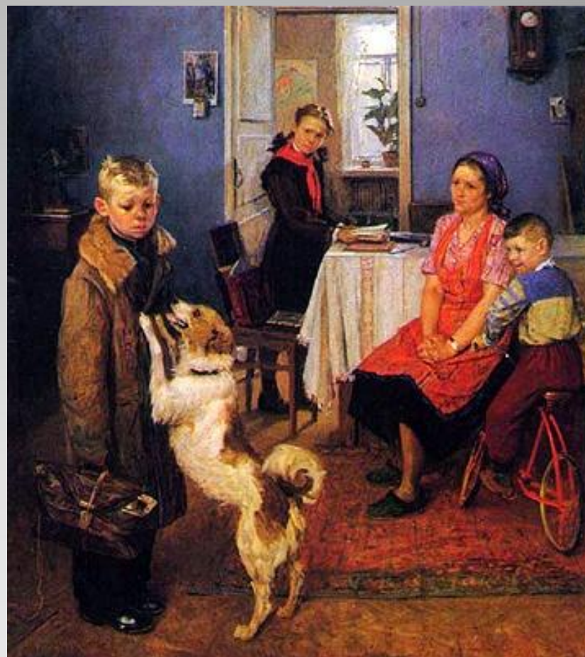
Ф. Решетников «Опять двойка»

Дети несут ответственность за то, как они учатся.