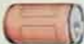
Пивная банка 0,33 л