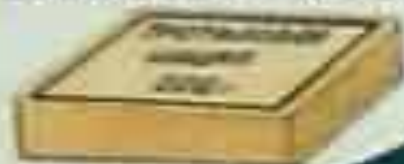
Шашка массой 200 г