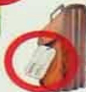
БЕСХОЗНЫЕ СУМКИ, ПОРТФЕЛИ, ПАКЕТЫ