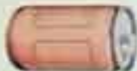
Пивная банка 0,33 л