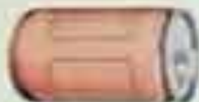
Пивная банка 0,33 л