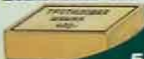
Шашка массой 400 г