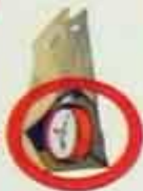
ЗВУК ЧАСОВОГО МЕХАНИЗМА