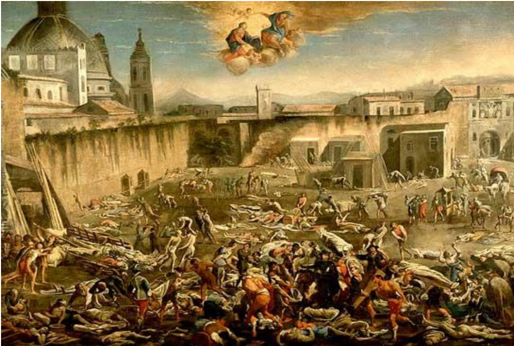
КАРТИНА ЧУМА В НЕАПОЛЕ В 1656 показывает опустошительное действие Черной Смерти (Музей Сан-Мартино, Неаполь.)

Эпидемия - это массовое, прогрессирующее во времени и пространстве в пределах определенного региона распространение инфекционной болезни людей, значительно превышающее обычно регистрируемый на данной территории уровень заболеваемости.